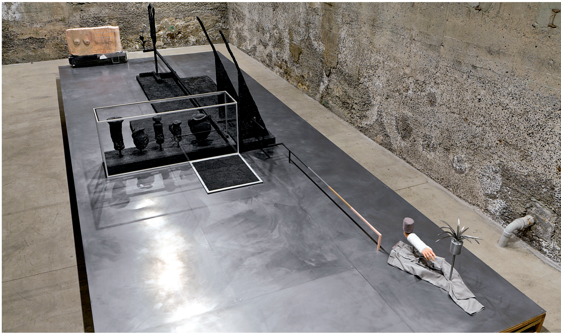
Une vue générale de l'œuvre de Michael Jones McKean.

The Gilded Scab , titre de l'actuel projet, est une installation plus horizontale que verticale, ce qui étonne déjà, vu la hauteur des plafonds. L'ensemble a des airs de plateforme muséale, bien chromée, et on la parcourt comme si elle avait été aménagée à même un site archéologique.