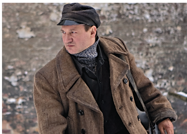
Socha, le petit voleur qui s'humanise peu à peu