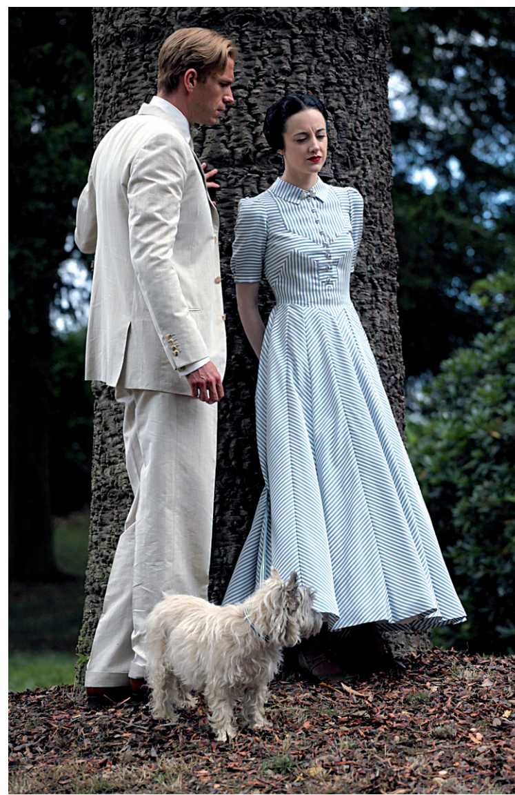
James D'Arcy et Andrea Riseborough dans W.E. de Madonna

Mais la «material girl» cède une fois encore à sa propension au vampirisme de la culture populaire, et ici du cinéma. Souvent incapable de faire confiance à la générosité de ses interprètes, émerveillée par la beauté des lieux chics où elle plante sa caméra, elle s'adonne à l'esbroufe cinématographique. C'est ce qui explique, à défaut de justifier, ses clin d'œil aux ralents de Wong Kar-wai ( In the Mood of Love ) ou aux contrepoints musicaux de Sofia Coppola ( Marie-Antoinette ), emprunts parmi d'autres d'une spécialiste du recyclage médiatique.