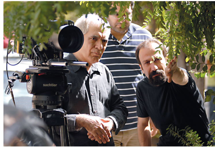
Asghar Farhadi (à droite) et son caméraman sur le plateau d' Une séparation