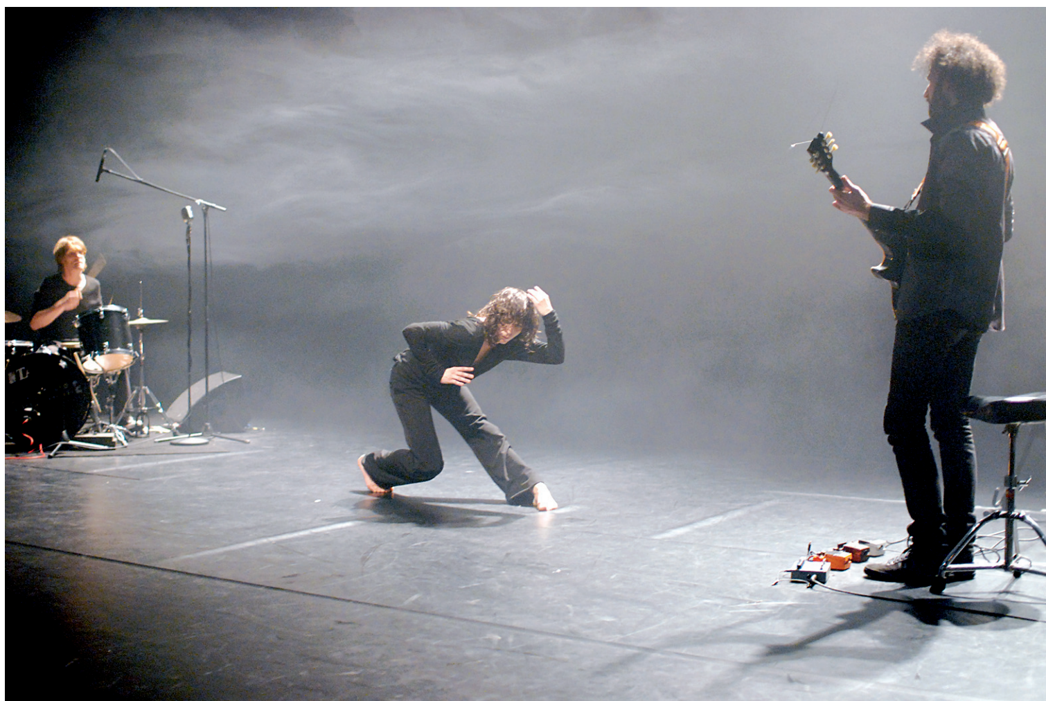
Une scène de Birth of Prey

Pour voir des extraits des spectacles des quatre chorégraphes québécois culture/danse