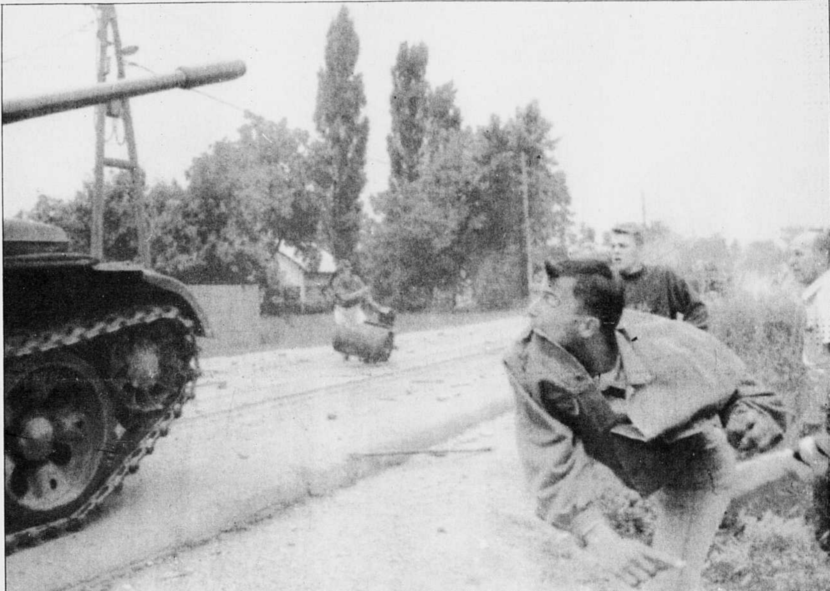
Si les ardeurs de l'armée fédérale yougoslave, contrôlée par les Serbes, ont réussi à faire plier les Slovènes, en Croatie, les indépendantistes s'en sont pris hier aux chars qui tentent de s'imposer à Zagreb. La partie n'est pas terminée de ce côté.