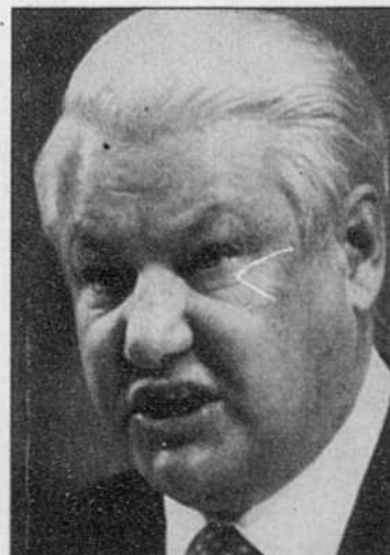
De Nicolas II à Eltsine en passant par Staline, une même politique d'empire.