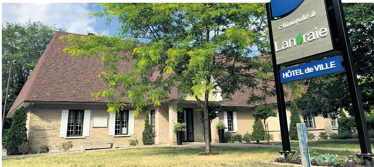
La Municipalité de Lanoraie invite la population à se plonger dans l'histoire du mouvement patriote.