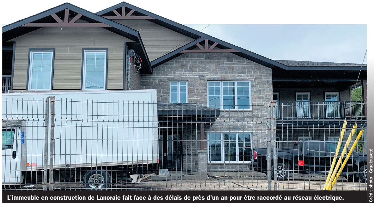
L'immeuble en construction de Lanoraie fait face à des délais de près d'un an pour être raccordé au réseau électrique.

Le raccordement d'India Venne requiert l'expertise d'un ingénieur pour analyser la capacité des transformateurs dans la rue afin de savoir s'ils sont aptes à alimenter un immeuble supplémentaire. Puisqu'il y a beaucoup d'autres dossiers qui demandent l'aide d'un ingénieur, l'entrepreneure s'inquiète de voir son projet retardé : « Dans une construction neuve, tous nos travaux sont synchronisés et nous avons des dates à respecter. » Puisque la société d'État est la seule qui offre ce service, M me Venne considère que de rendre le problème public est la seule option pour faire avancer les choses.