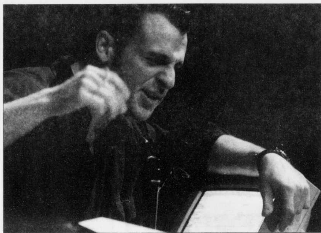
Patrick Huard dans « Talk Radio »