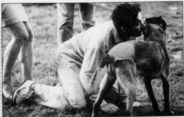
Alain Chabat joue le rôle d'un labrador changé en humain avec tous les problèmes que cette situation suppose.

Je ne vous ferai pas l'insulte de recommander Titanic ou un obscur film roumain pour cette première. Allons-y pour Didier . Oui, je sais, le scénario a la mineur de la feuille de papier sur lequel il est écrit et les personnages sont à l'avenant. Le film est français en plus, avec tout ce que ça suppose. C'est un peu con, un peu bête (excusez le jeu de mots facile avec le sujet du film). Mais il y avait longtemps que je ne m'étais autant amusé au cinéma. On ne rigole pas épais