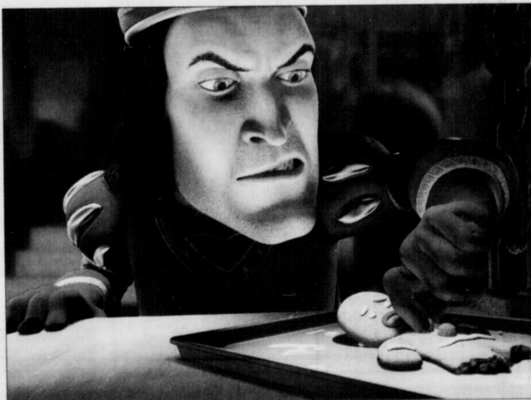
Lord Farquaad, le vilain monarque soumet à la torture le bonhomme en pain d'épice.