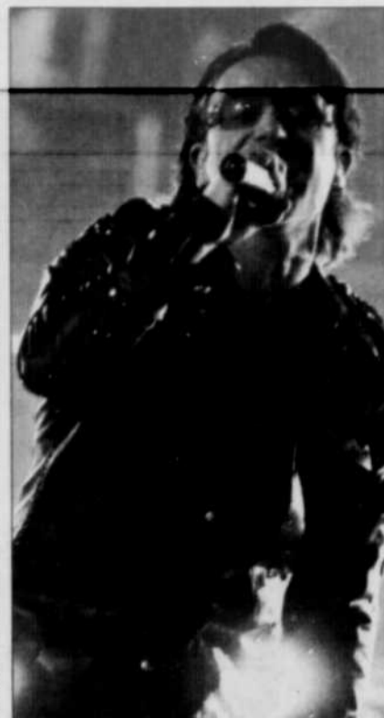
Ceux qui vont manquer la nouvelle tournée de U2 pourront se consoler avec «Pop Mart», à MusiquePlus.

ron cède sa place à Jardin d'aujourd'hui . À 19 h, Coup de cœur présente la comédie Simon Birch avec Ian Michael Smith, Joseph Mazzello et Ashley Judd. Les souvenirs d'enfance d'un homme avec son meilleur ami, atteint d'un syndrome retardant sa croissance. À 21 h 30, on présente un épisode de Chroniques de l'étrange .