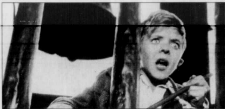
« Le tambour », ce soir à Télé-Québec.

Anne-Marie Losique était à Cannes pour recueillir les commentaires de Francis Ford Coppola, d'Emmanuelle Béart et de Pascale Bussières. L'actrice québécoise n'est pas près d'oublier l'accueil qu'on lui a réservé au festival. Il est aussi question du film Moulin rouge avec Nicole Kidman, Ewan McGregor, John Leguizamo et le réalisateur Baz Luhrmann. Anne-