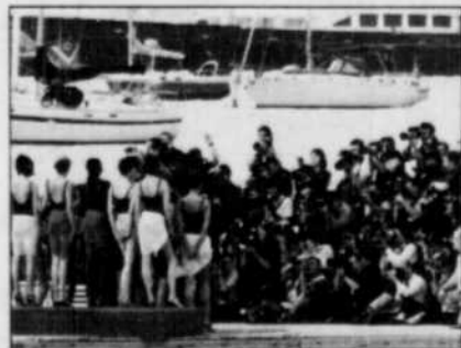
10h45: Attroupement au quai de la plage de l'hôtel Martinez.

□ 11h L'attente se poursuit... □ 11h20 ...et n'en valait pas la peine. Une délégation de mannequins, that's all . Les filles se font mitrailler pendant de longues minutes. « C'est folklorique... », lance une curieuse, en tournant les talons. □ 11h30 Conférence de presse de Jacques Rivette et de l'équipe de son film, au Palais. Le cinéaste est de fort belle humeur.