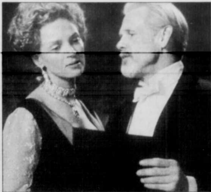
L'aventurière Charlotte Stant (Uma Thurman) épouse Adam Verve (Nick Nolte) dans « La coupe d'or ». Dans ce film basé sur le chef-d'œuvre de l'écrivain Henry James, le cinéaste James Ivory atteint des sommets dramatiques et esthétiques.