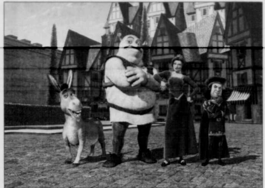
L'âne, inséparable compagnon d'aventures de l'ogre Shrek, la belle princesse Fiora et le vilain Lord Farquaad.

Le pari est relevé avec brio, d'abord et avant tout grâce à la technologie utilisée pour faire vivre les person-