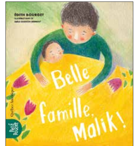
Parmi les auteurs de la région qui ont lancé un livre en 2021, on compte Édith Bourget. Cette dernière a publié «Belle famille, Malik!».