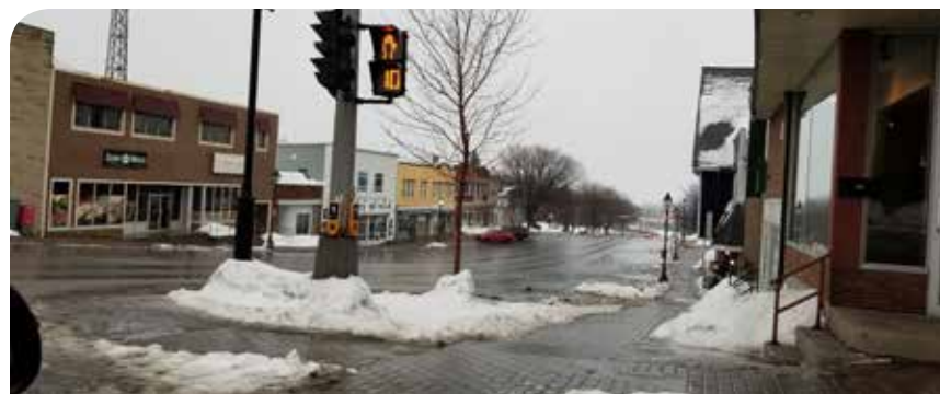
Depuis le début de la pandémie, le Nord-Ouest a vécu quelques épisodes de confinement.

Certaines régions du Nouveau-Brunswick ont connu une augmentation de nouveaux cas de COVID-19 et le Nord-Ouest est dans une situation simi-