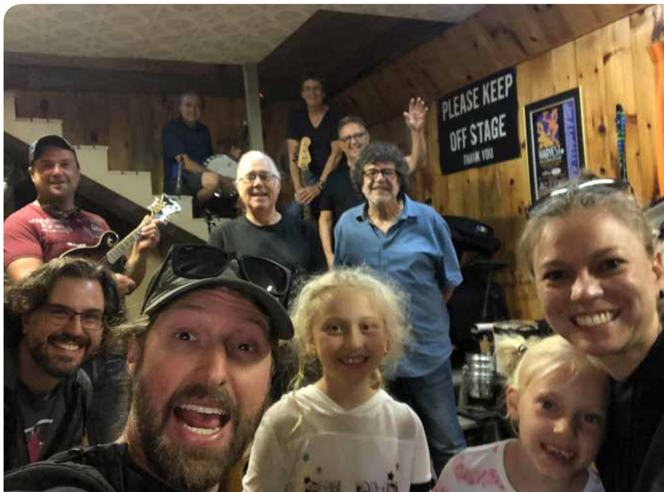
En 2021, un projet n'attendait pas l'autre pour le Choeur virtuel de l'Acadie.