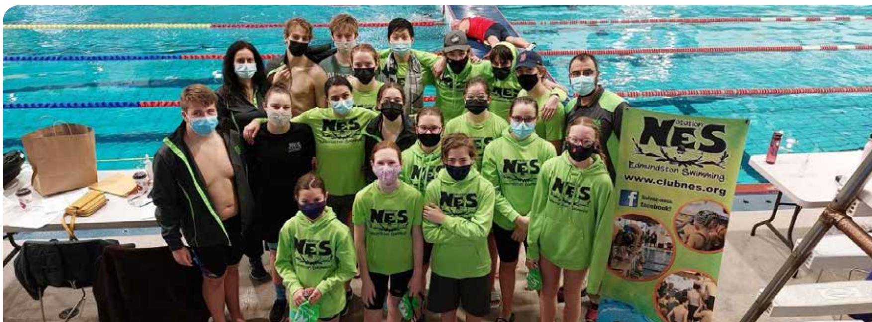
Lors de leur participation au Championnat par équipe Marianne Limpert, les 18 représentants de NES ont fait bonne figure.