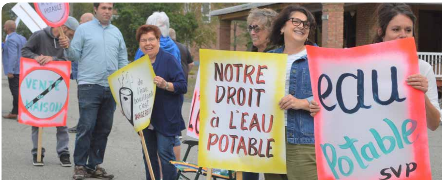
Privés d'eau potable depuis des mois, les citoyens du quartier Saint-Hilaire ont lancé un cri du cœur lors d'une manifestation pacifique.