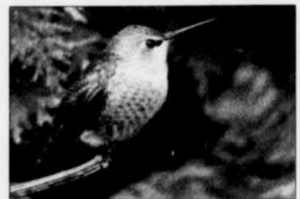
Un visiteur inusité : un colibri d'Anna

aux vivaces qui intéressent particulièrement les colibris. C'est avec l'aimable permission de la Fondation de la faune que je vous offre ce tableau et, si vous voulez en savoir plus, vous pouvez vous rendre dans le site Internet de la Fondation, au www.fondationdelafaune.qc.ca . Vous cliquez sur Publications et vous pouvez télécharger trois dépliants qui s'intitulent Faites la cour aux oiseaux . C'est gratuit !