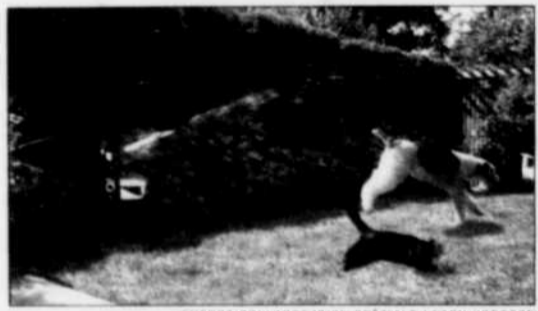
Le Scarecrow saura faire détalier les indésirables.

Pour connaître le point de vente le plus près de chez vous, téléphonez au (418) 871-0434 ou envoyez un courriel à jazzboivin@sympatico.ca . C'est une excellente idée de cadeau pour les jardiniers de tous les niveaux et votre achat aidera les recherches sur cette maladie terrible.