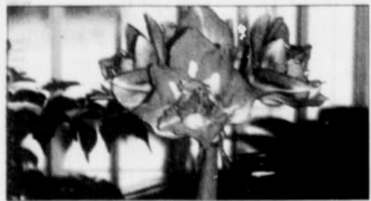
L'amarillis est toujours un cadeau fort apprécié.

LIVRES C'est le cadeau de Noël traditionnel pour les jardiniers amateurs. Sans doute qu'il a déjà mis quelques titres sur sa liste de souhaits. Sinon, allez voir vous-même : le choix est vaste ! Attention toutefois aux livres de jardinage européens, souvent très beaux et très alléchants, mais dont les renseignements ne conviennent pas aux jardiniers d'ici. Préférez un livre québécois ou traduit de l'américain, car habituellement ils visent plus juste. Prix variés : 10 à 70$ ou même plus.