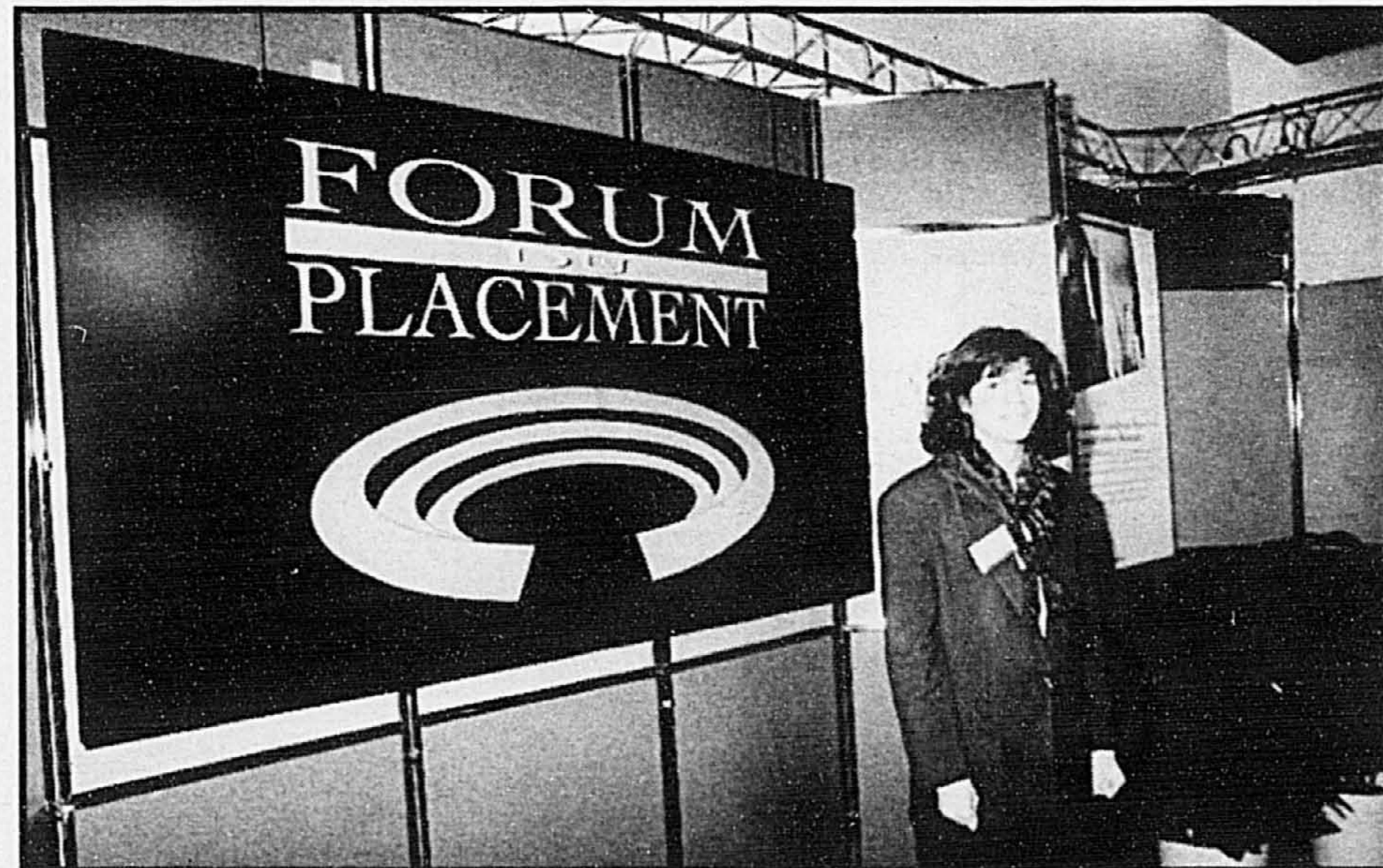
Que nous réserve l'économie en 1995? Comment choisir un portefeuille d'obligations? Comment investir à la bourse? Voilà ce que les gestionnaires de la Caisse de dépôt et placement du Québec dévoileront aux visiteurs dans leur très populaire FORUM DU PLACEMENT.