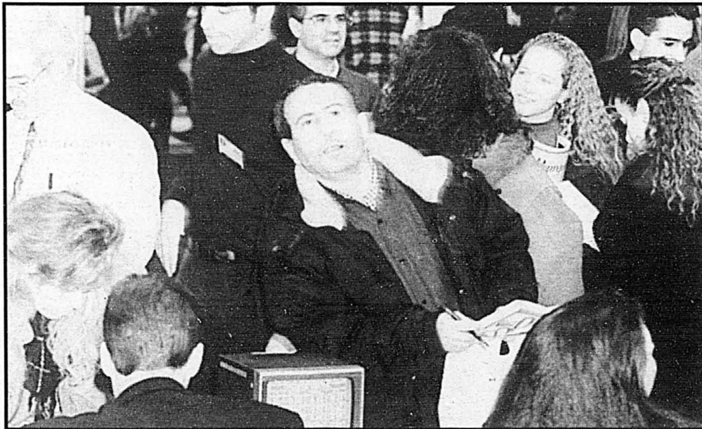
La Bourse de Montréal vous a préparé un feu roulant d'activités: conférences sur les stratégies d'investissement, coup d'oeil sur la relève, librairie sur le placement et jeu interactif pour mesurer vos connaissances.

En collaboration avec la COOP des HEC et Logimens, la Bourse de Montréal mettra également à la disposition des visiteurs un large éventail de livres et de logiciels sur le placement.