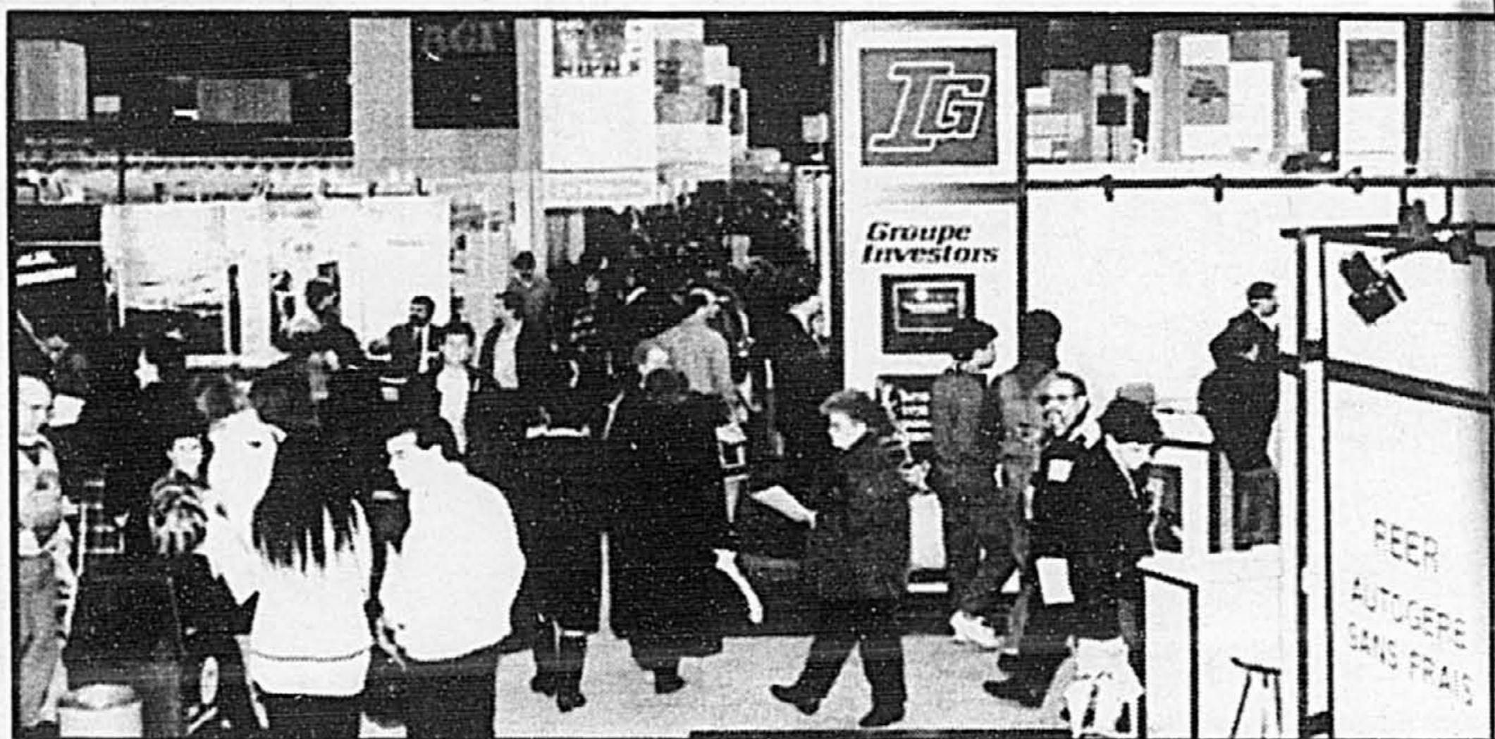
Le 14 e Salon Épargne-Placements ouvrira ses portes jeudi prochain, le 27 janvier, sous le thème de la liberté financière. Les épargnants et investisseurs trouveront sur place tous les conseils et l'information nécessaire pour faire fructifier leur capital.

Vous pourrez obtenir des commentaires beaucoup plus élaborés sur ces stratégies en vous rendant au stand numéro 538 de Lévesque, Beaubien, Geoffrion, situé en plein cœur du Salon.