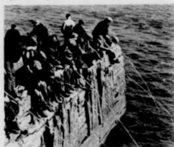
L'Univers des sports