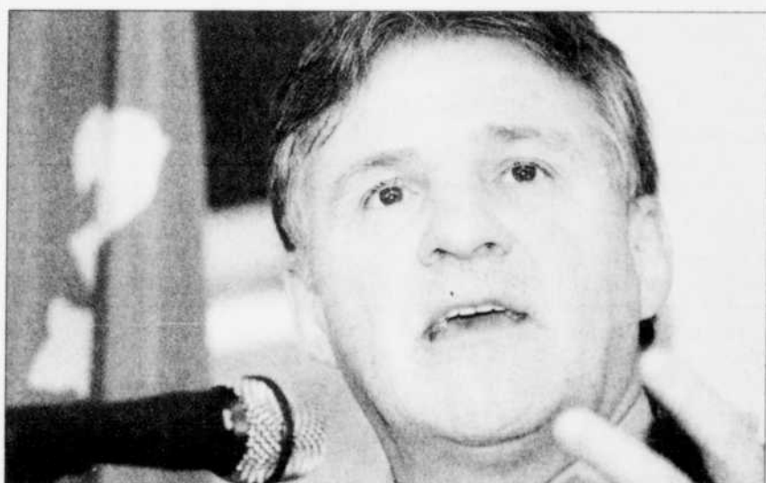
Le ministre de l'Environnement Paul Bégin a annoncé hier une subvention spéciale de 150 000 $ pour équiper les 31 résidences touchées de systèmes de traitement d'eau. Il a aussi demandé de l'aide au fédéral pour identifier la source.