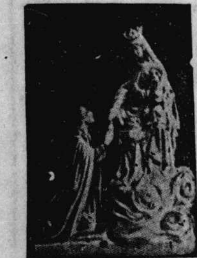
PRIERE EFFICACE A MARIE, REINE DES COEURS

La reproduction de cette prière a été payée par un particulier de Montréal pour faire "extra-ordinaire" recues de MARIE REINE DES COEURS dont le sanctuaire est situé à Saint-Théodore de Chertsey, comté de Montréal, avec promesse de publier dans l'espérance qu'elle bénéficiera à d'autres.