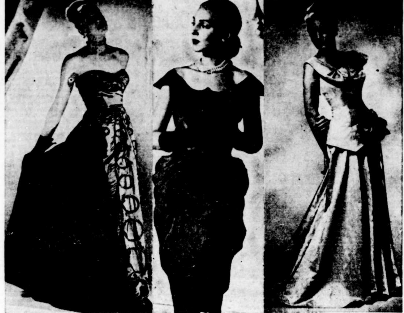
La mode d'automne nous a apporté une pléiade de riches toilettes pour le soir, toutes les créations des grands couturiers entrent dans la danse le soir des grands bals; Le satin, le taffetas, le tulle, se frôlent sur les parquets luisants. Les tailles affimées les épaules découvertes ou drapées dans des capes seyantes feront le charme et l'élegance de cette société gracieuse.