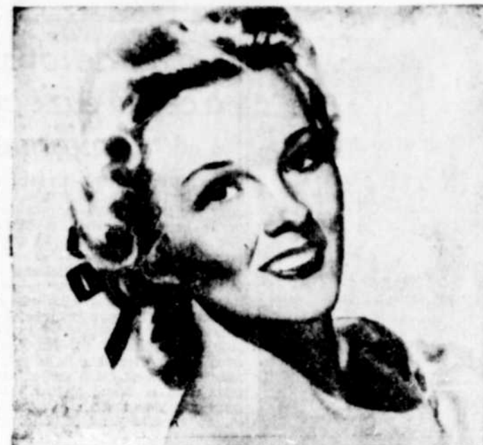
Gloria Massey et Neilson Eddy, dans "Northwest Out Post", que tout le monde voudra voir.