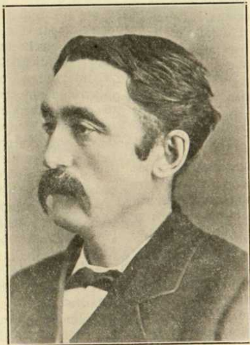
EMMANUEL BLAIN DE SAINT-AUBIN

ait jamais songé à faire un recueil de ses compositions, aussi ce qui nous en reste est-il incomplet et encore, dans ce nombre, on devra faire un choix, c'est-à-dire publier les pièces qui caractérisent son genre de talent. Il y a bien la musique de dix ou douze de ses pièces, mais où peut donc se trou- ver celle des autres, s'il l'a écrite..... Tant de pièces avaient un cachet personnel que l'auteur lui-même se