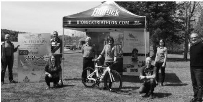
Les partenaires associés dans l'organisation du premier Triathlon Bionick de Lac-Etchemin ont tenu un point de presse le 28 avril dernier sur les terrains de l'Éco-Parc des Etchemins, point central de l'événement.

« C'est une belle approche que de commencer avec les mesures sanitaires en vigueur. Ce sera moins stressant dans la mesure où on accueillera un peu moins de monde cette année. Il y aura beaucoup d'aspects techniques à considérer, comme le fait de fermer les routes et tout cela, mais nous sommes bien entourés », poursuit-elle en ajoutant que d'autres épreuves secondaires pourraient s'ajouter dès l'an prochain.