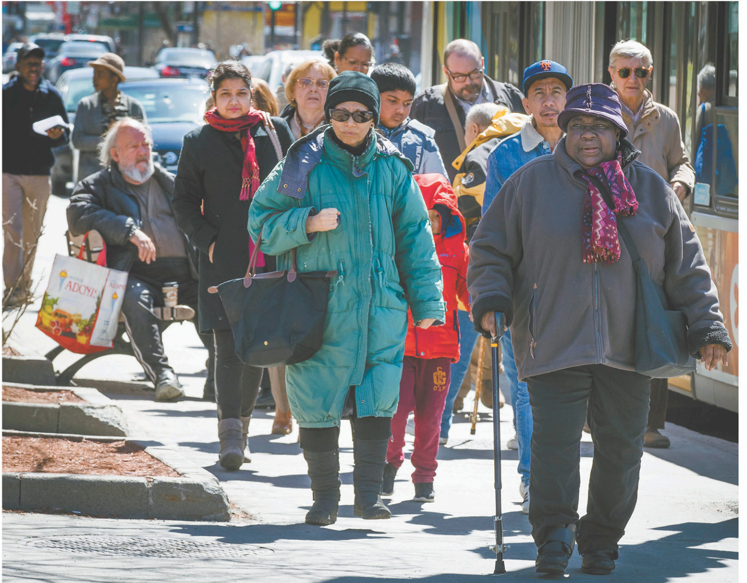
Au cabinet du ministre de l'Immigration, de la Diversité et de l'Inclusion, on assure que le Québec continuera de déployer des efforts pour attirer les francophones, mais on souligne qu'il est déjà bien outillé.

Le discrédit des responsables politiques dans ce dossier, alimenté par leur incapacité évidente à proposer quelque perspective que ce soit pour se sortir de leur modélisation de la seule loi que respectent désormais les multinationales : tout ce qui est permis est prescrit.