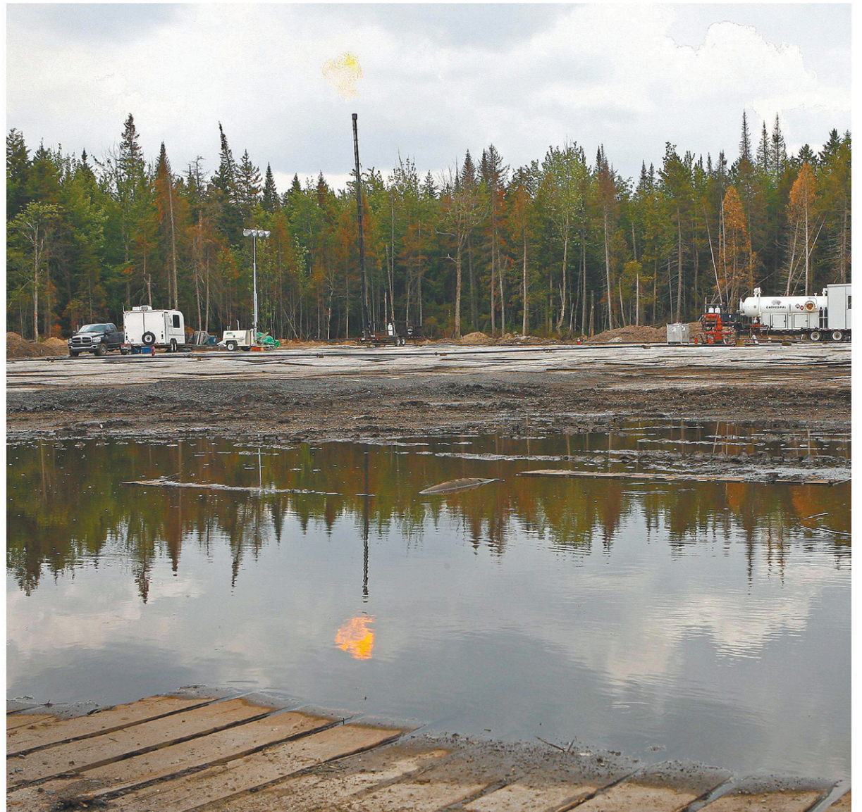
Une dizaine d'entreprises détiennent actuellement un total d'environ 13 000 km 2 de permis d'exploration dans le sud de la province. En photo, un puits de la compagnie albertaine Talisman, à Saint-Édouard-de-Lotbinière, dans la région de Chaudière-Appalaches.