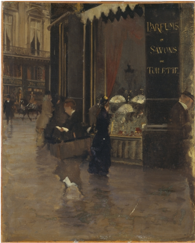
Giuseppe de Nittis, Parfumerie Violet , 1880, 41 x 32 cm, huile sur toile, Musée Carnavalet (Paris)