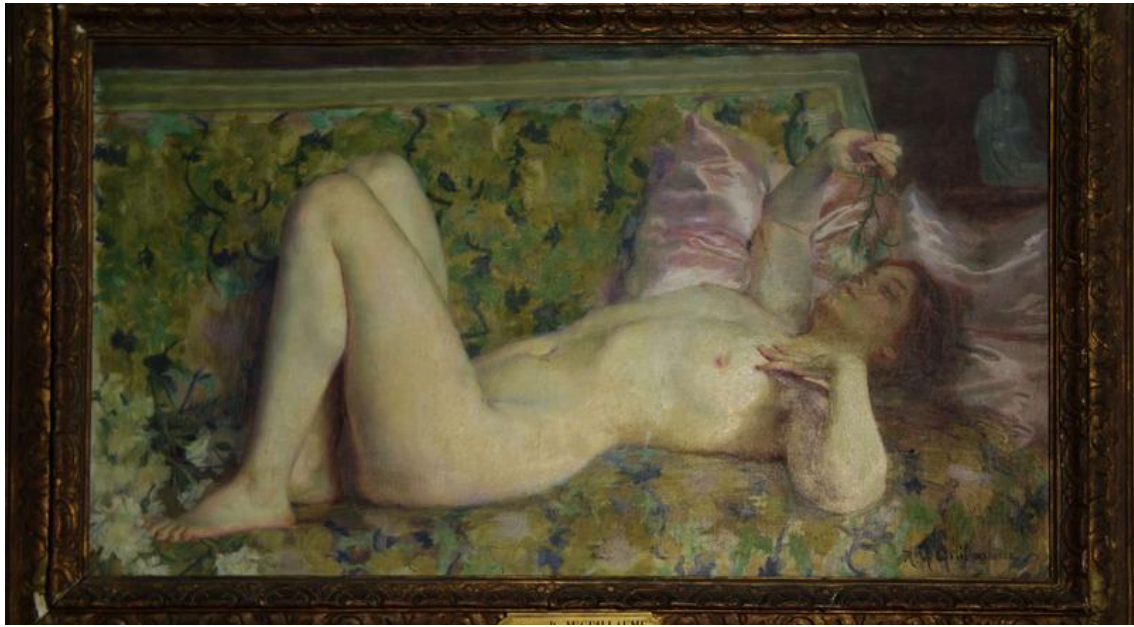
Guillaume R. M., Le Parfum , vers 1900, huile sur toile, Musée de Saint Nazaire.