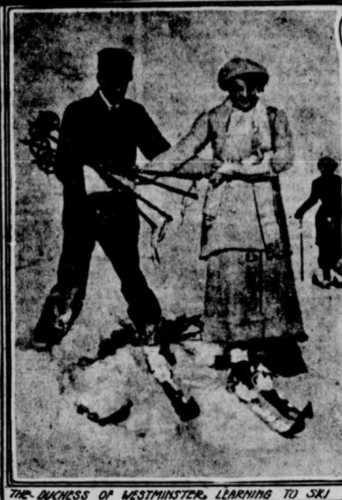
LA DUCHESSE DE WESTMINSTER APPRENANT A MARCHER EN SKIS

Les princes du sang royal conserveront leur rang ; la noblesse aura les droits et les privilèges des citoyens ordinaires, les propriétés privées seront protégées ; les nobles seront exemptés du service militaire ; la république accordera à tous la liberté de conscience.