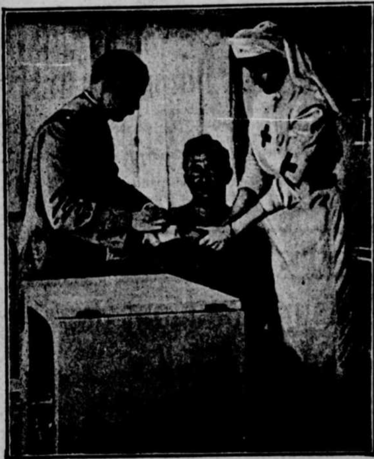
AMBULANCIERE ITALIENNE RECEVANT SES INSTRUCTIONS D'UN CHIRURGIEN - MAJOR QUI VIENT DE FAIRE L'EXAMEN D'UN BLESSE.

Les Italiens conservent leurs positions malgré les attaques fréquentes qu'ils ont à subir de la part des turcs et des arabes.