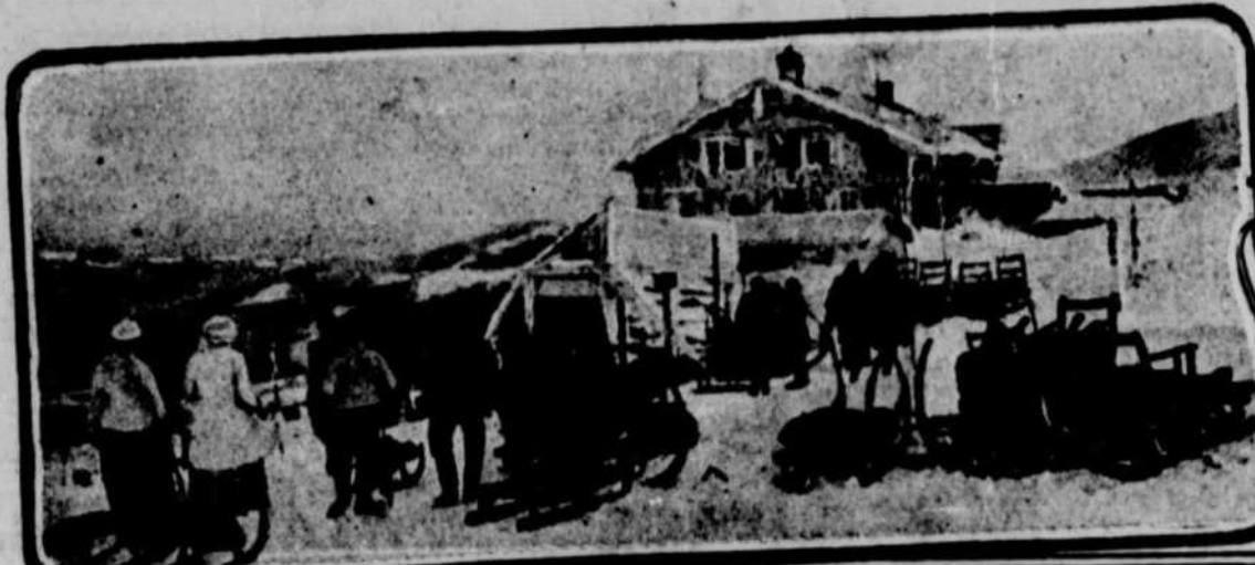
LE PRINCE HENRY DE PRUSSE SORTANT DE LA RESIDENCE, SILESE ET SA SUITE EN SILESE