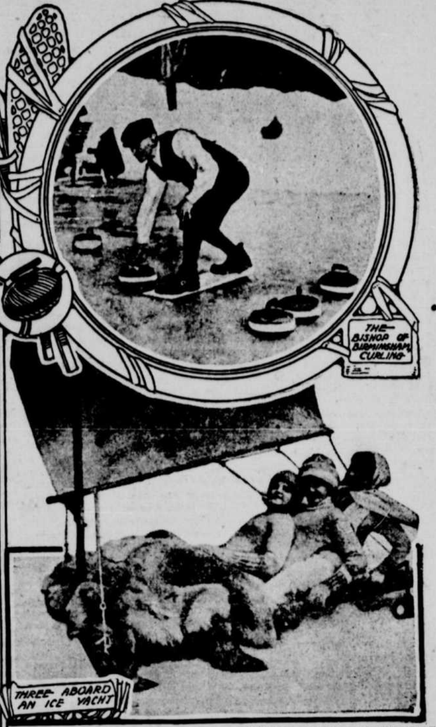
TROIS JOLIES FEMMES FAISANT UNE PROMENADE EN ICE-BOAT

ou du sucre d'érable, ont donc intérêt à savoir exactement quelle est la proportion d'eau que contiennent leurs produits, mais beaucoup de ceux qui en fabriquent ne savent pas comment vérifier cette proportion et par conséquent, en mettant leurs produits sur le marché, ils ne savent pas s'ils sont bien en règle avec la loi.