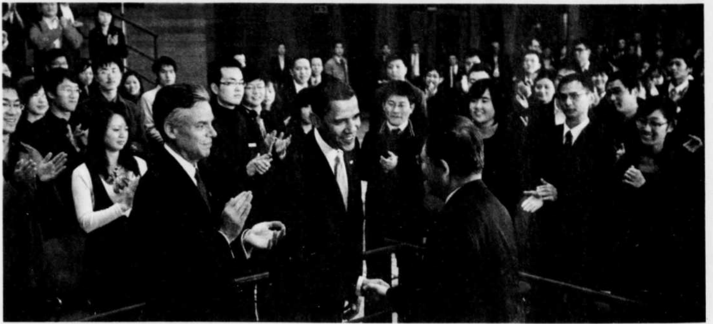
Le président Barack Obama a rencontré hier des étudiants à Shanghai.