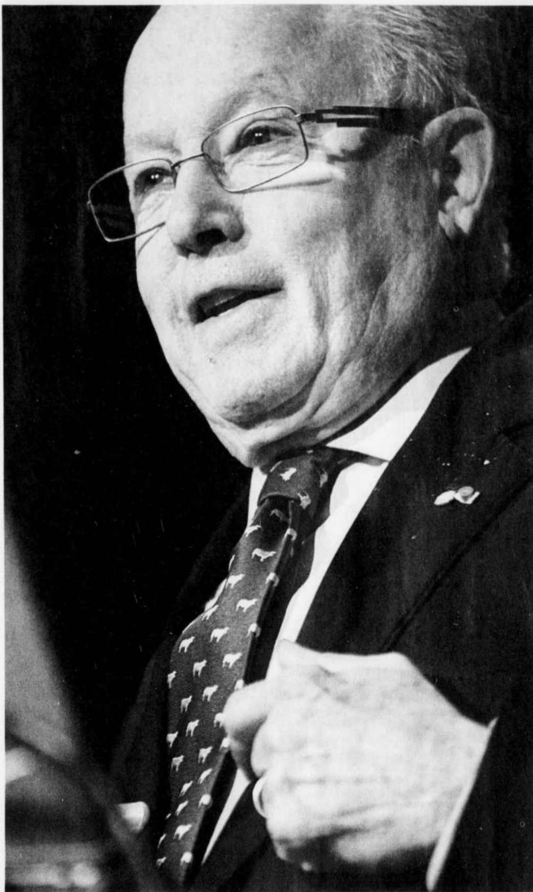
L'ancien premier ministre Bernard Landry était conférencier invité, hier, au Sommet international du jeu de Montréal, qui réunissait de jeunes travailleurs et créateurs du multimédia.