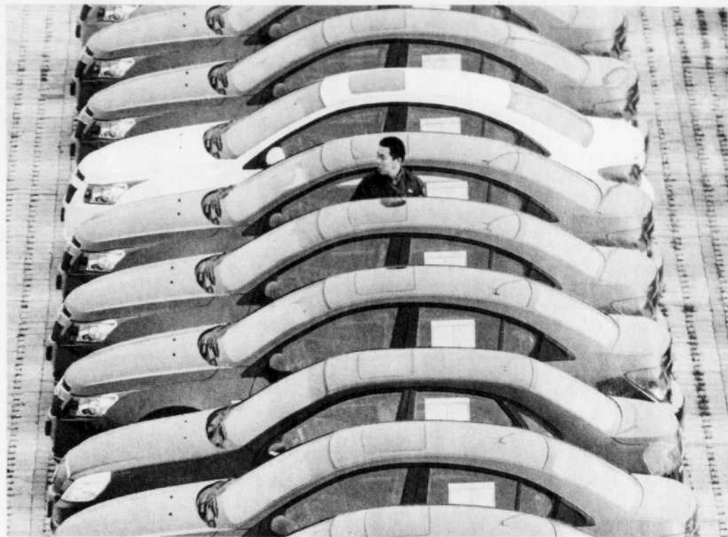
GM a enregistré un chiffre d'affaires de 28 milliards entre juillet et septembre, soit 4,9 milliards de plus que le «vieux GM» au deuxième trimestre.

GM se donne pour priorité d'«accélérer ses remboursements» aux États-Unis et au Canada, avec un premier versement de 1,2 milliard dès décembre. GM pourrait même rembourser la totalité des 6,7 milliards qu'il doit au gouvernement américain et du 1,4 milliard