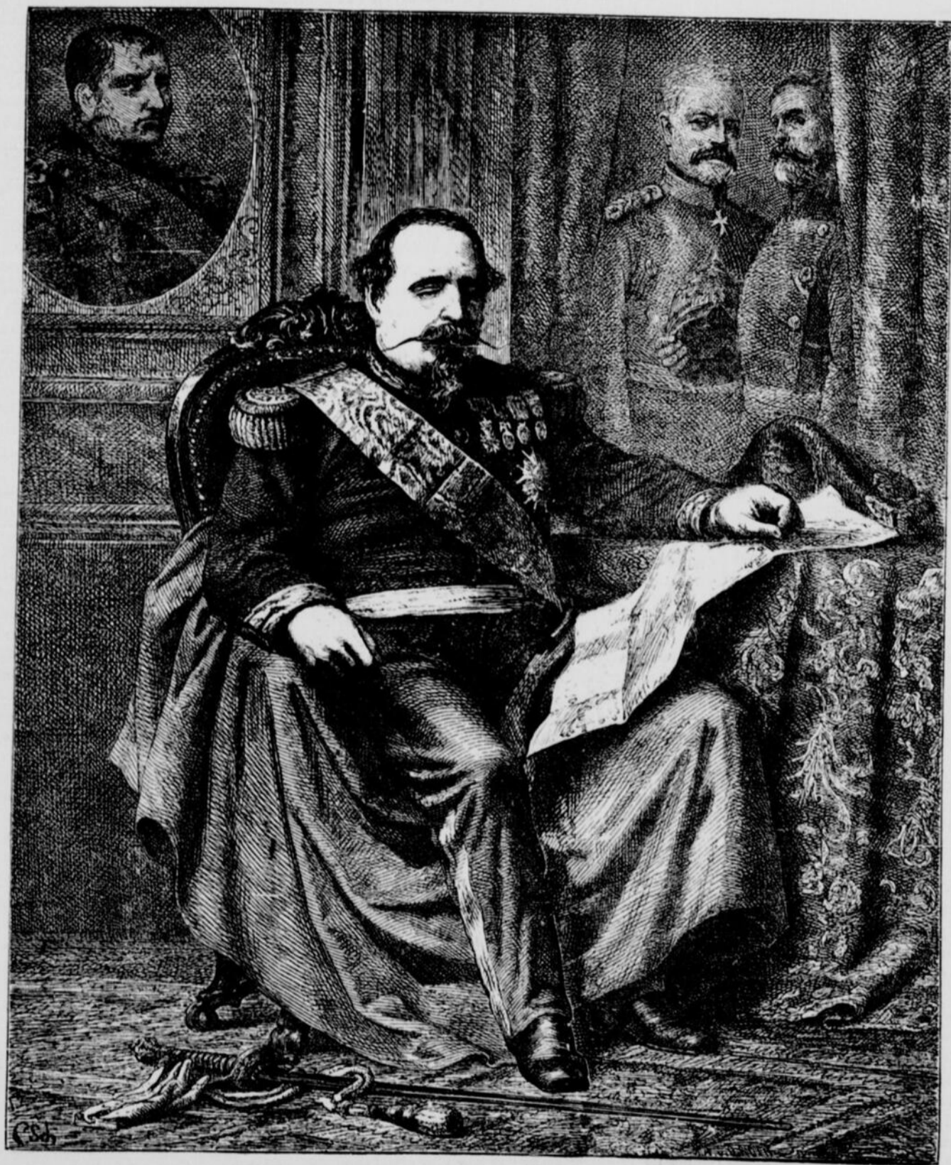
NAPOLEON III APRES SA DEFAITE A SEDAN.

Les députés, pompeusement requis par l'élégant et souple