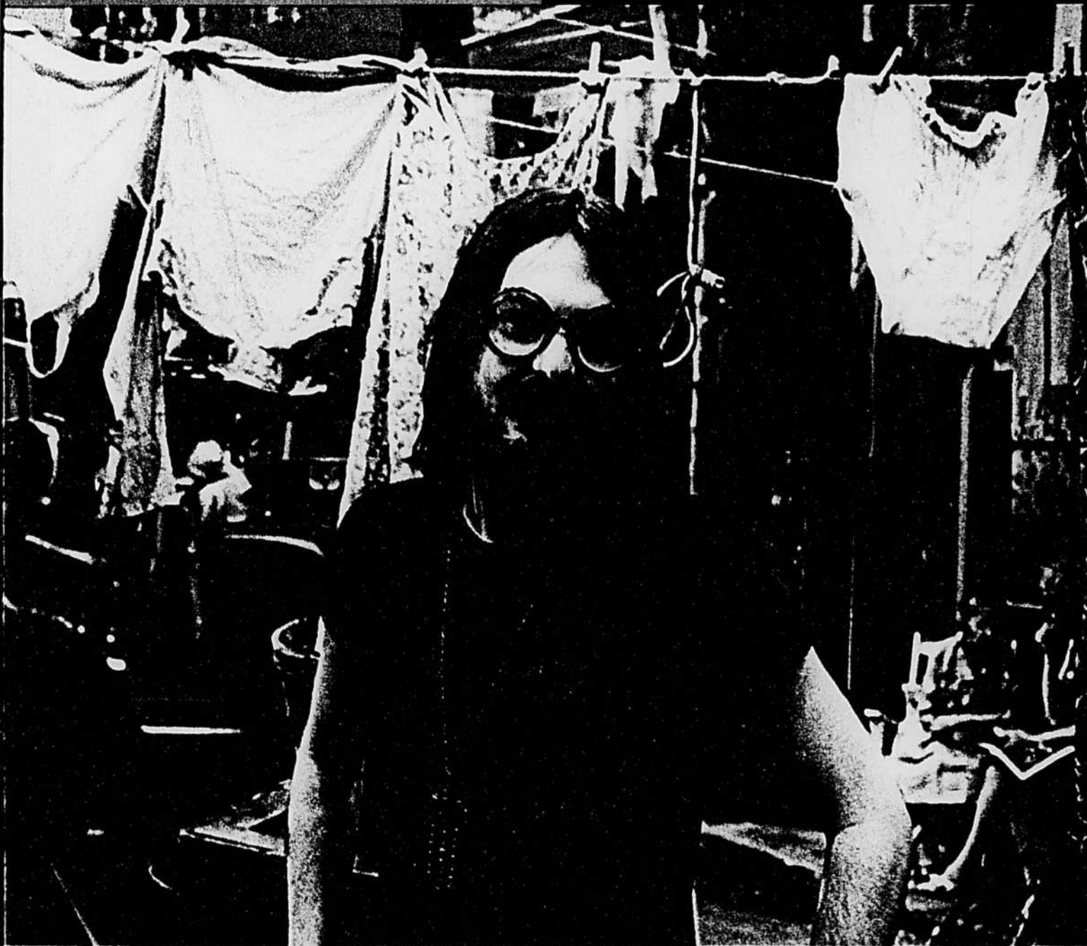
MICHEL TREMBLAY en pièces détachées