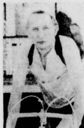
Au Cinéma canadien qui sera télévisé le 10 juillet à 23 hres. Radio-Canada vous propose un film intitulé "Vive la France".