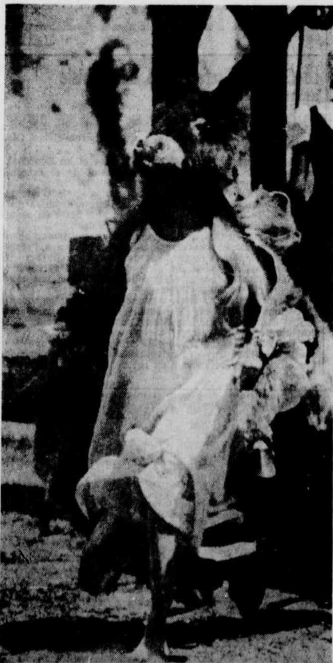
C'est dans un fabuleux décor où la couleur joue un rôle important que se déroule le fantastique conte de Perrault "Peau d'Ane".

A la fin du texte est indiqué, quand il y a lieu, la convenance pour les jeunes: (e) enfants; (a) adolescents.