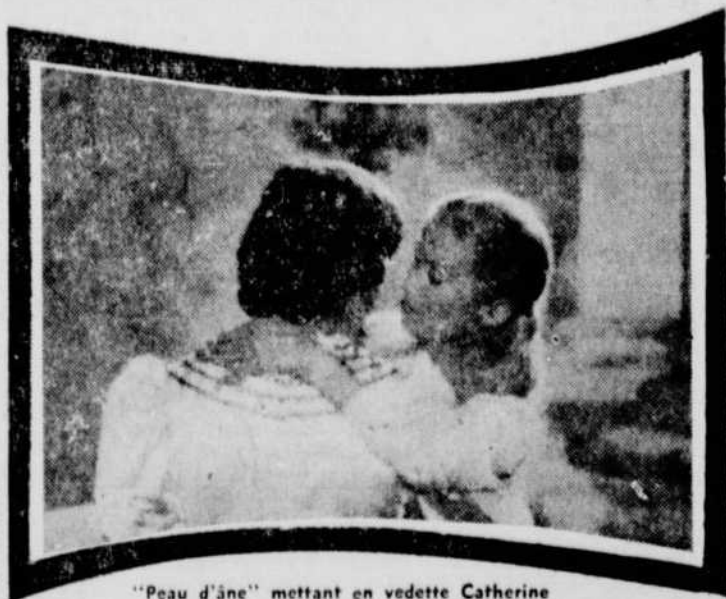
"Peau d'âne" mettant en vedette Catherine Deneuve et réalisé par Jacques Demy est présentement à l'affiche au cinéma STE-FOY, salle Champlain.