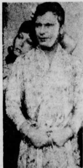
C'est un film de Claude Chabrol intitulé "Les Biches" qui vous sera présenté au cinéma le samedi 7 juillet à 23 hres.