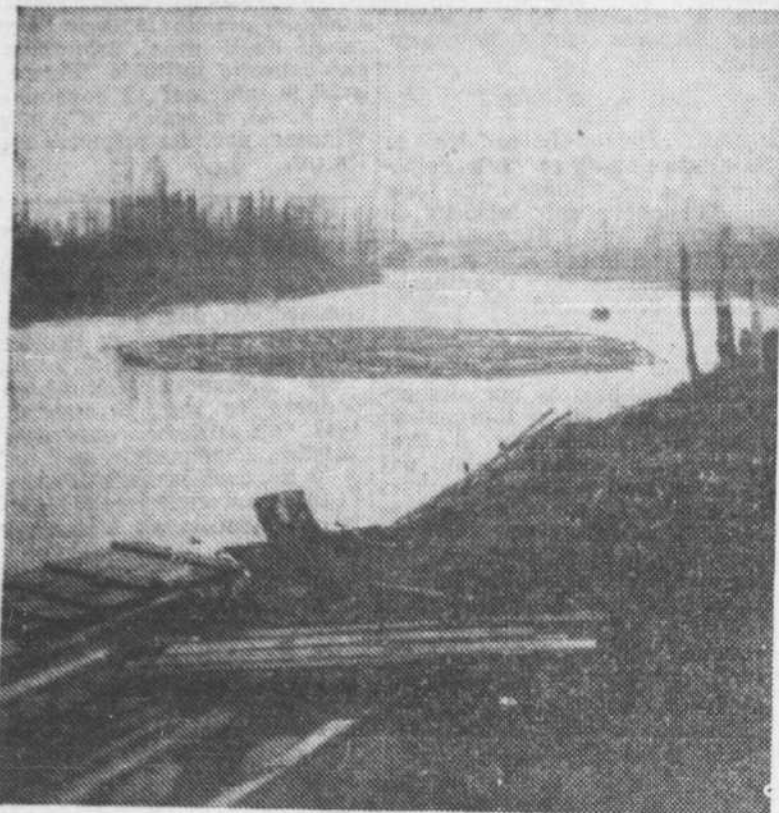
Les rivières d'Abitibi coulent au nord... (Aux confins du Canton Paradis, cage de bois remorquée vers le sud à l'aide d'une motogodille).