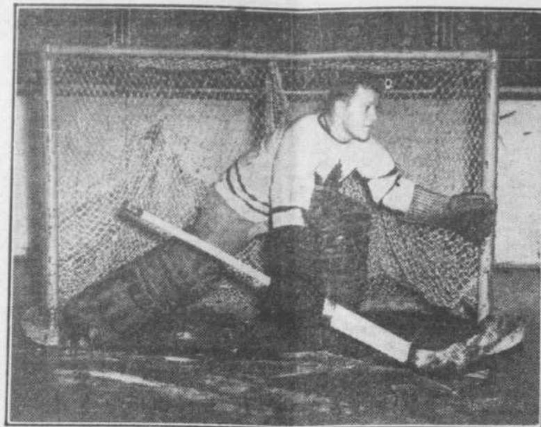
Turk Broda, le gardien des buts des Leafs de Toronto, qui rivalisera d'adresse avec Bill Duran, du Canadien, dans la joute de ce soir, qui aura lieu au Forum. On s'attend à un duel intéressant entre ces deux cerbères.

Troisième période 7—Lachine: McDonald... 6.55 8—Lachine: Y. Laplante... 10.32 9—Leafs: Roy... 12.30 10—Leafs: Beaudoin... 16.44 11—Leafs: Lemaire... 17.16 12—Leafs: Parr... 19.50