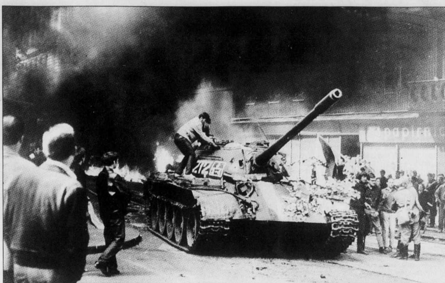
Des troupes de l'Union soviétique, de la Pologne, de l'Allemagne de l'Est, de la Bulgarie et de la Hongrie ont franchi la frontière tchécoslovaque vers 11 heures, mardi soir.

Le ministre a ajouté qu'il n'y avait pour l'heure rien à faire et peu à craindre quant au danger d'hostilités. Le ministre a-t-il dit, recueille les informations et une revue de la situation sera faite ce matin. Au besoin, le cabinet se réunira. [...]