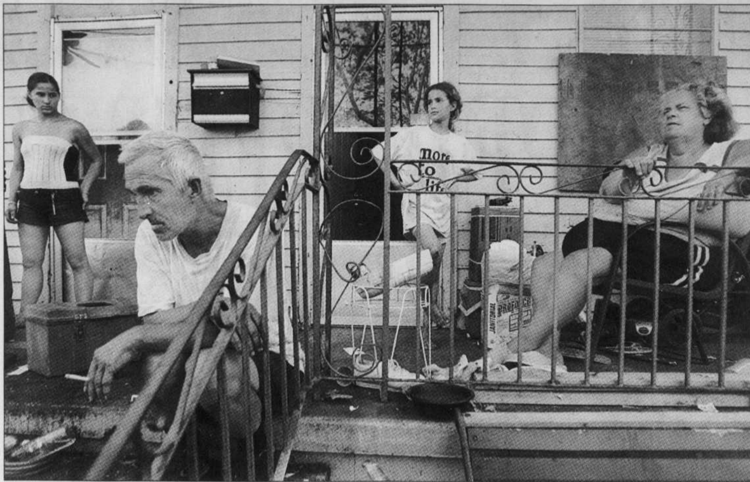
La famille Everett, déjà pas très fortunée, a vu sa situation empirer avec le passage de l'ouragan Katrina.