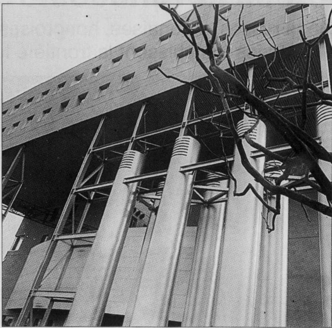
École des hautes études commerciales à Montréal.

Avec un peu de chance et beaucoup de travail, le professeur gagnera de la notoriété dans son domaine de recherche, ses pairs citeront ses articles et