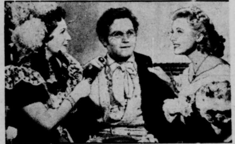
Ilona Massey, Alan Curtis et Binnie Barnes, dans une scène de "New Wine", à l'affiche au Théâtre

Gloria Jean, la talentueuse petite cantatrice, tient la vedette du film "Get Hep To Love", une joyeuse comédie musicale où la musique et la danse ne sont pas sous le coup du rationnement. Jane Frazee, Robert Paige et Donald O'Connor complètent la distribution de ce film qui nous relate l'histoire d'une petite célébrité du monde musical qui s'enfuit de chez elle pour vivre une vie normale qu'elle ne semble pas devoir connaître à son foyer.