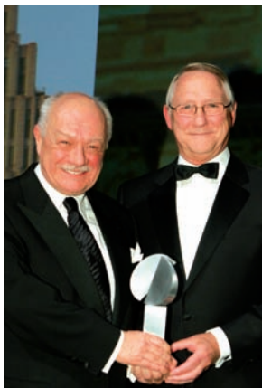
M. Charles Lapointe, c.p., et M. Gérald Tremblay, maire de Montréal

Élu député de Charlevoix en 1974, monsieur Lapointe a été titulaire de plusieurs ministères fédéraux. Membre du Conseil privé, Charles Lapointe a aussi occupé le poste de Receveur général du Canada. Après quelques années à la direction d'entreprises du secteur privé, il est nommé président-directeur général de Tourisme Montréal en 1989, poste qu'il occupe encore à ce jour. De 2001 à 2007, Charles Lapointe a été président de la Commission canadienne du tourisme. Il siège également à l'Organisation mondiale du tourisme à titre de représentant du Canada.