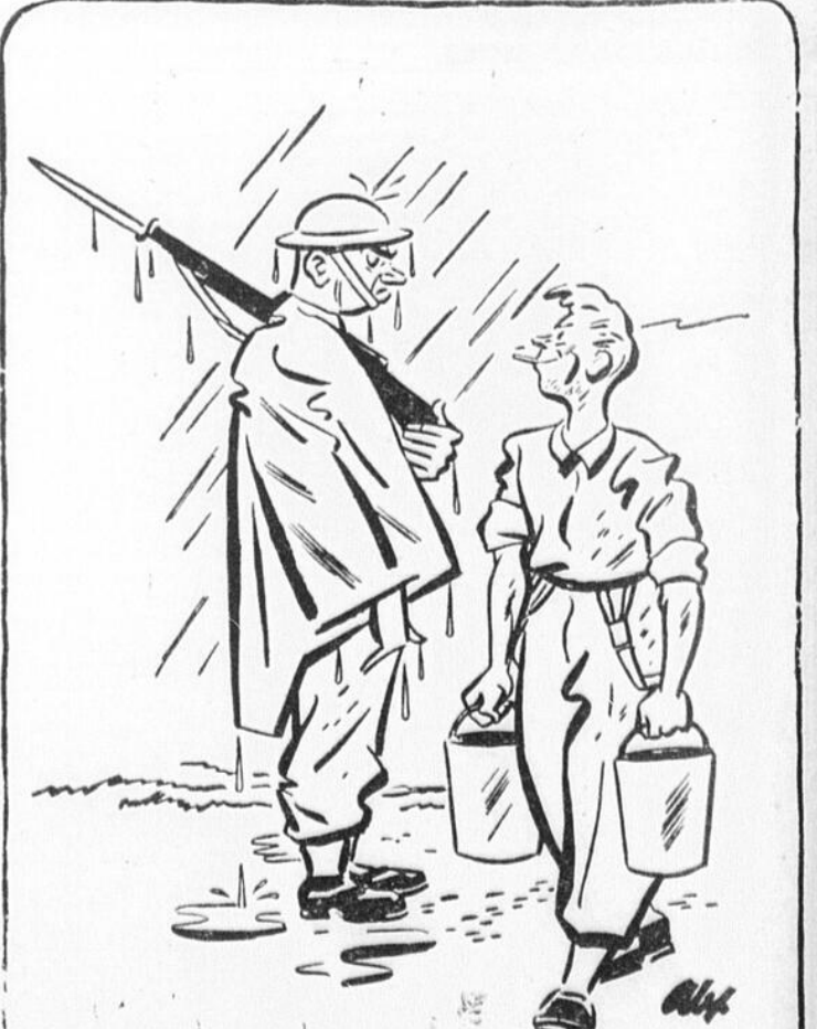
"T'en fais pas mon vieux. Cela pourrait aller plus mal. Tu n'as tout de même pas encore été torpillé." (Rappelez-vous la Semaine de l'Armée)