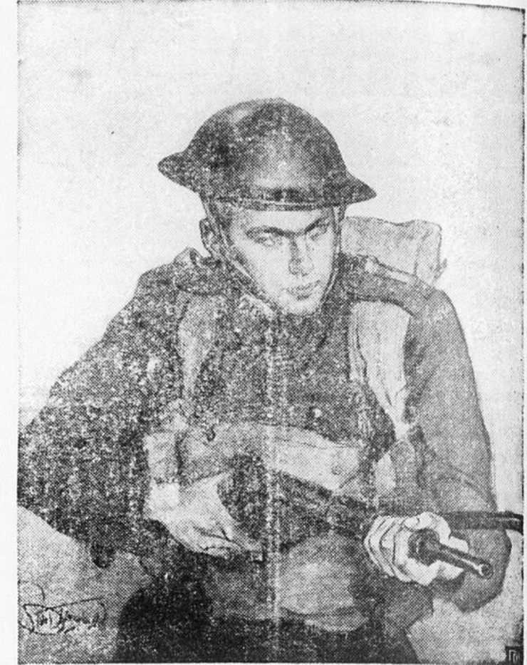
Symbolie de l'esprit agressif du soldat canadien ce dessin de l'artiste Grant Macdonald de Toronto montre un fantassin armé d'une mitrailleuse Sten. Cette mitrailleuse très légère maniable de l'épaule comme de la hanche est l'arme idéale des troupes de choc et des parachutistes.

dividende de vingt-trois cents (23c) par action a été déclaré sur les actions ordinaires, sans valeur nominale, de la compagnie pour le trimestre le 30 juin 1942, payable le 25 août aux actionnaires inscrits sur les registres en date du 24 juillet.