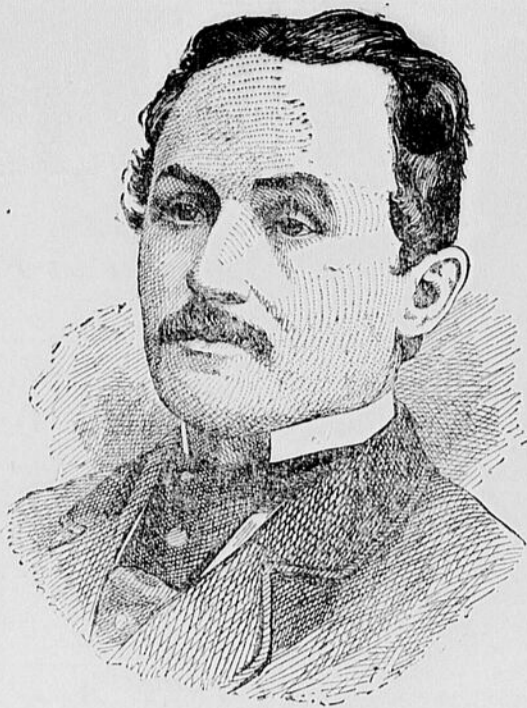
Le Maire de Québec.

Les étrangers ont commencé à montrer leurs binettes hier, et se coudoient un peu partout dans les couloirs du Windsor, du St-Louis Hall et du Richelieu. Il n'y en a pas autant qu'on veut bien le dire dans les journaux, mais ils forment tout de même un contingent assez respectable de la population, pour la huitaine, surtout si l'on considère la rigueur de la température dans le moment. S'il n'y a pas de cinq à six pieds de neige dans les principales rues, comme à Québec, dit la Minerve ,