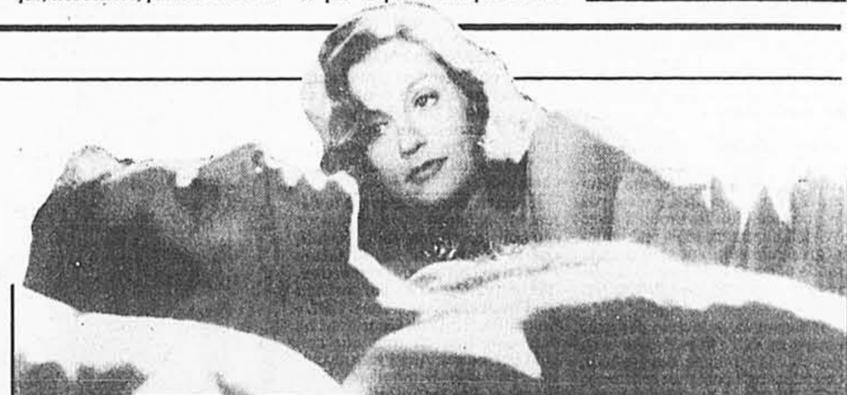
Steve Cuttenberg et Isabelle Huppert entretiennent une liaison amoureuse qui les mettra aux prises avec une affaire de meurtre, dans The Bedroom Window .

ACTION Charley Hannah v/ The Man Who Broke 1000 Chains AVENTURE Les longs manteaux Red Heat COMEDIE Penn and Teller: Cruel Tricks The Squeeze vo et vf Taking It All Off DOCUMENT Sharks The True Story DRAME Casino Love of Africa Hamburger Hill Mafia Princess Matewan *** Nights in White Satin ENFANT/FAMILLE Le lion et la sorcière blanche HORREUR Howling III Le jour des fous Slaughter High v/ SCIENCE-FICTION L'étoile du mal SUSPENSE Faux témoin GENRE NON PRÉCISÉ Rolling Vengeance Supergrass *** Nos choix.