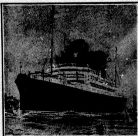
Le nouveau navire "Andania".

LIVERPOOL, Pier Head. LONDRES, 51 Bishopgate, E.C. 29 Cockspur St. S. W. PARIS, 37 Boul. des Capucins.