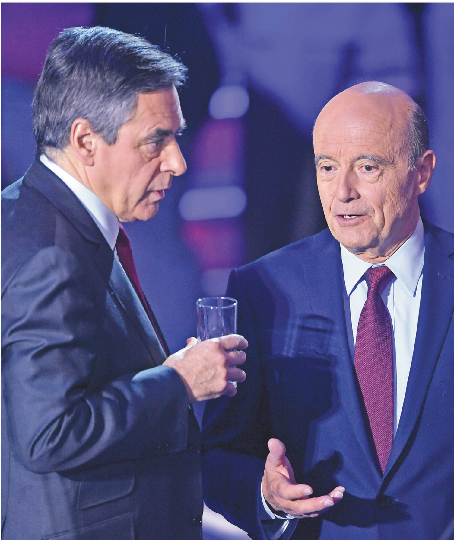
Si seul le vote des Français résidant en Amérique du Nord avait été comptabilisé, Alain Juppé aurait obtenu la majorité absolue au premier tour de la primaire de la droite.

CAHIER B • LE DEVOIR, LES SAMEDI 26 ET DIMANCHE 27 NOVEMBRE 2016