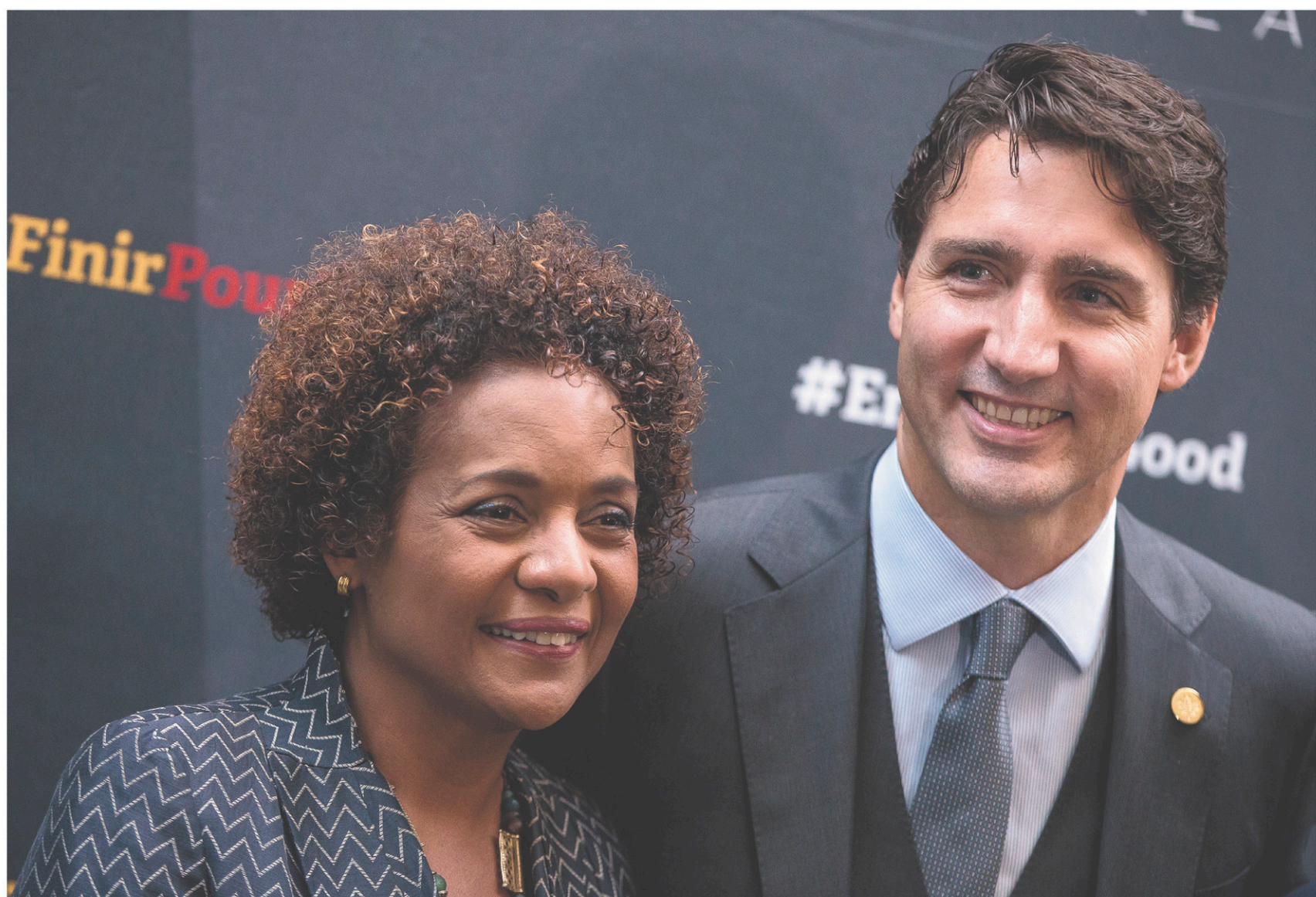
Le premier ministre Justin Trudeau, ici aux côtés de la secrétaire générale de la Francophonie, Michaëlle Jean, a déposé officiellement la candidature de l'Ontario au poste d'observateur de l'Organisation internationale de la Francophonie (OIF).

Alors que le gouvernement Obama est entré dans une course contre la montre pour sauvegarder les terres publiques avant le 20 janvier en interdisant l'exploitation aurifère sur un large territoire près du parc de Yellowstone et le forage dans l'océan Arctique au large de l'Alaska, en annulant des permis miniers et d'exploitation pétrolière et gazière au Montana et au Colorado, il affirme prudemment vouloir laisser le processus suivre son cours dans les prochaines semaines. Mais Standing Rock est devenu un cri de ralliement pour les autochtones et les environnementalistes : le nouveau gouvernement vient peut-être, avant même d'entrer en fonction, de « frapper son premier mur ».