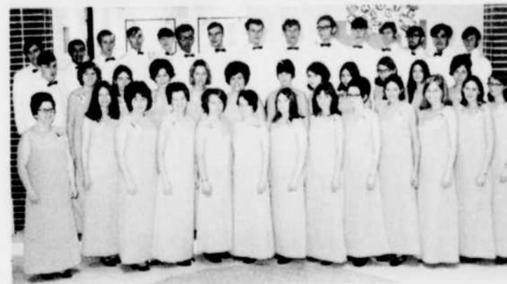
Les Gais Chanteurs de Gran'Digue, chorale de Moncton, se feront entendre à «Mille et une notes», le dimanche 26 avril à 10 heures, à la radio.