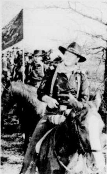
«Les Cavaliers», samedi 25 avril à 23 h 30