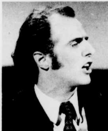
Les tout-petits feront la connaissance de Gilles VIGNEAULT, à «Tour de terre», à 17 h 30.