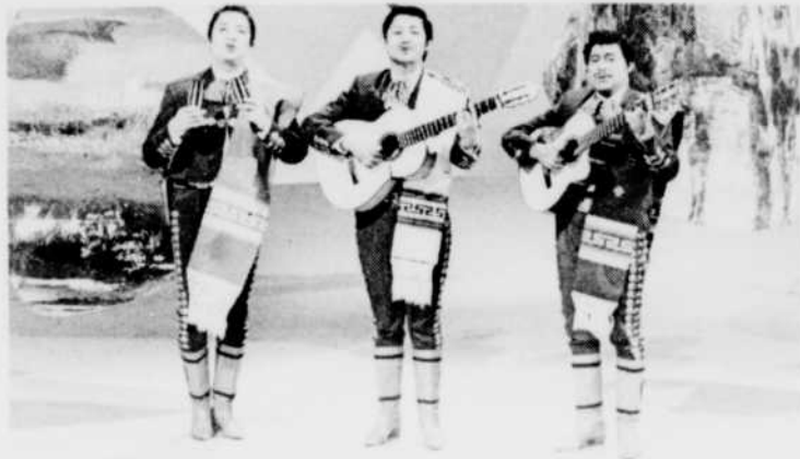
Los TRES COMPADRES

Michel Fugain écrit maintenant pour des artistes aussi variés