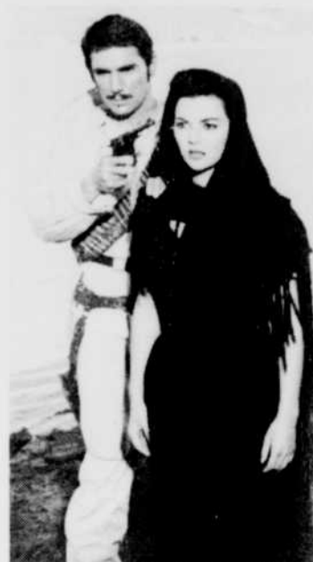
«Le Goût de la violence», le vendredi 1er à 13 h 00