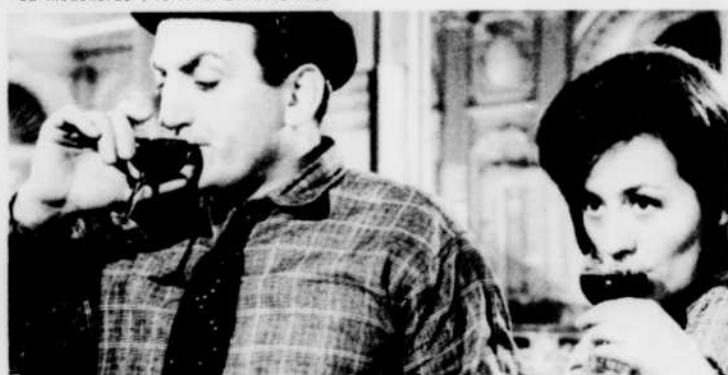
«Le Bateau d'Emile», le mardi 28 à 13 h 00