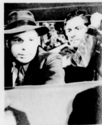
«Cinquième colonne», le mercredi 29 à 13 h 00