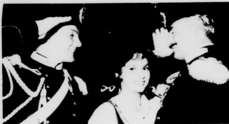
«Pain, amour et fantaisie», le lundi 27 à 11 h 15

Regardez le cinéma de 11 h 15 et de 13 h 00, du lundi au vendredi