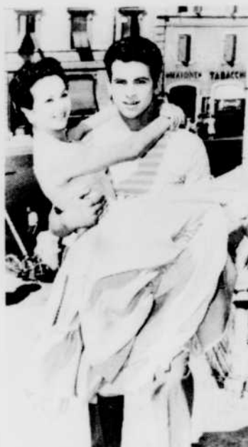
«Les Mauvais Garçons», le mercredi 29 à 11 h 15