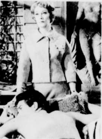
«Le Visage du plaisir», jeudi 30 avril à 23 h 40