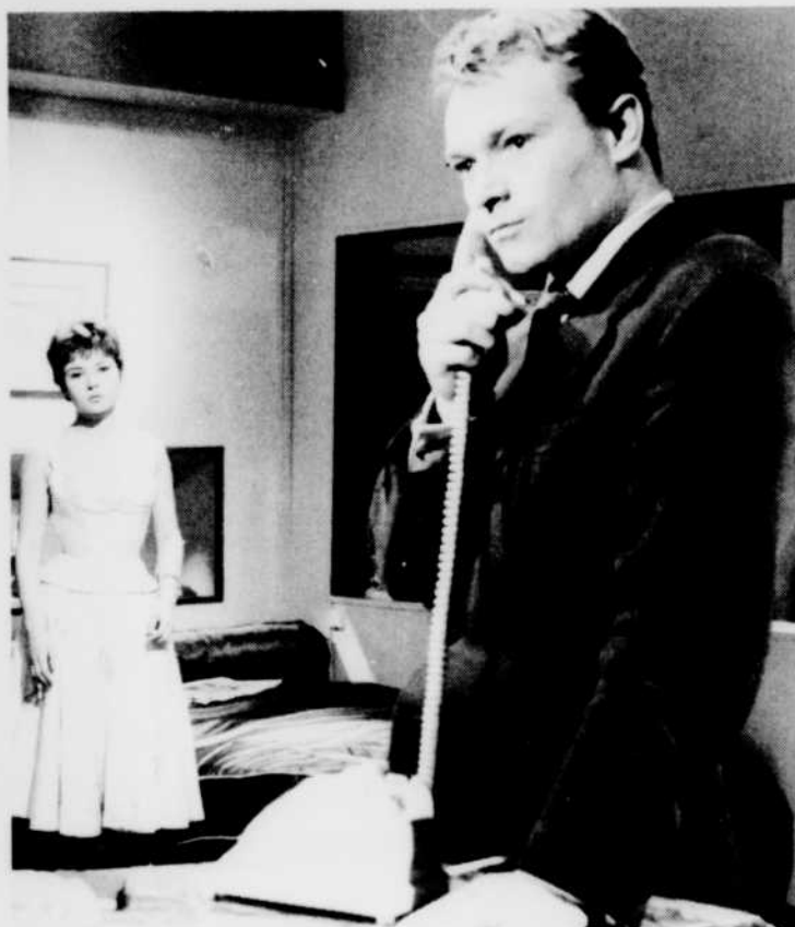
«La Moucharde», le lundi 27 à 13 h 00