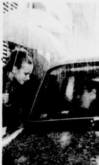
«L'Amour à la chaîne», vendredi 1er mai à 23 h 40