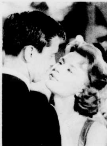
«Barbara», lundi 27 avril à 23 h 40