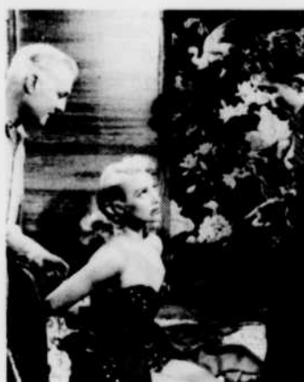
«Méfiez-vous des blondes», le vendredi 1er à 11 h 15