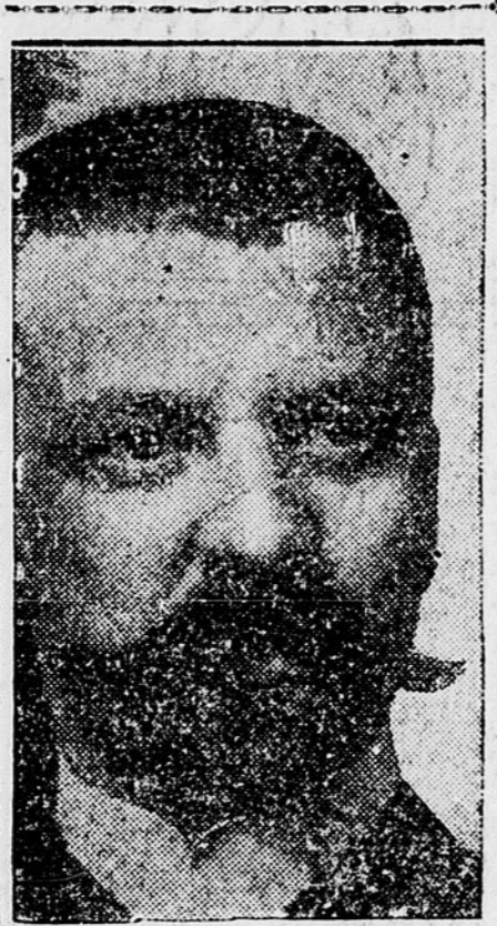
M. HENRI BOURASSA, Directeur du "Devoir", actuellement en tournée dans l'Ouest Canadien. Il a parlé à Winnipeg hier.

Le directeur du "Devoir" dans l'Ouest pour la première fois depuis 1913 — Il donnera trois discours au cours de son séjour dans l'Ouest.