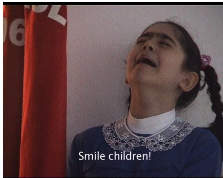
Katarina Zdjelar, Don't Do It Wrong , 2007. Image extraite de la vidéo.

Dans la vidéo Don't Do It Wrong (2007), Katarina Zdjelar (Serbie / Pays-Bas) pose un regard sur le moment où, chaque matin, les élèves d'une école primaire d'Istanbul chantent l'hymne national à l'entrée des classes. Alors que la formation des élèves en rangs évoque un « corps collectif » au sein duquel l'individu fait un avec la nation, le comportement des enfants contrevient sans cesse à l'unité qu'on tente de leur imposer.