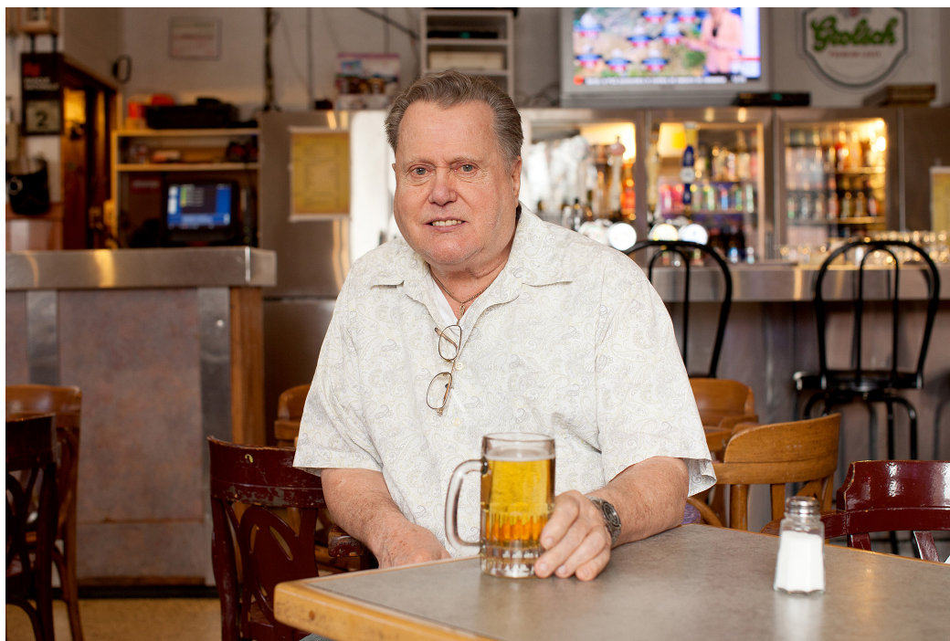
Emmanuelle Léonard, La taverne , 2015. Image extraite de la vidéo.

Réalisé avec la collaboration d'un petit groupe de clients réguliers et d'employés d'un bar de quartier, La taverne (2015) d'Emmanuelle Léonard (Québec) montre une succession d'individus s'adressant à la caméra. Les préoccupations et les convictions exprimées par les protagonistes inscrivent l'expression de l'expérience personnelle dans la vie sociale de l'endroit en même temps qu'elle situe les individus entre marginalité et stéréotype.