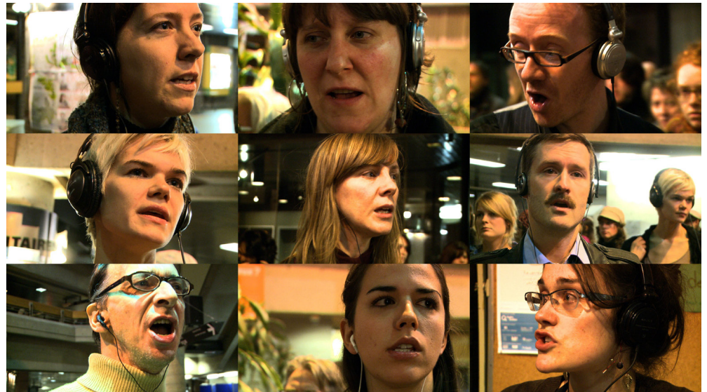
Sophie Castonguay, Isegoria , 2011. Performance avec récitants. Avec l'aimable permission de l'artiste. Photo : Simon Gosselin