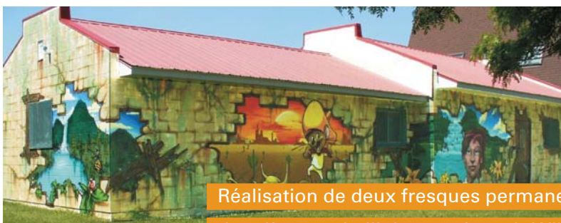
Réalisation de deux fresques permanentes, dont l'une embellit le parc Joseph-William-Gendron