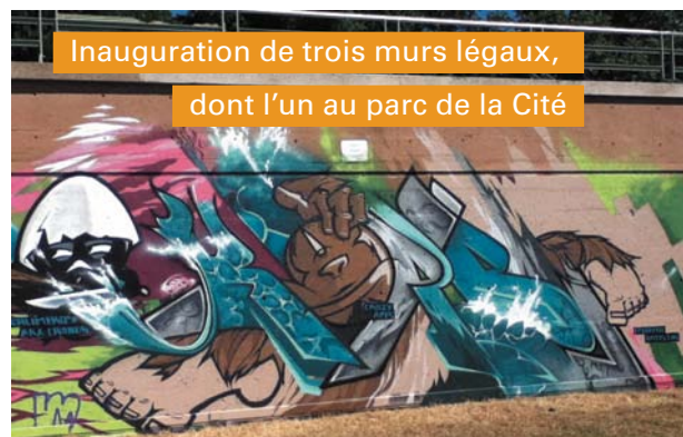
Inauguration de trois murs légaux, dont l'un au parc de la Cité