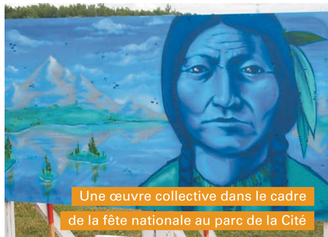
Une œuvre collective dans le cadre de la fête nationale au parc de la Cité

La mise en œuvre du plan se poursuivra en 2013. Pour en savoir plus, consultez longueuil.ca/graffitis