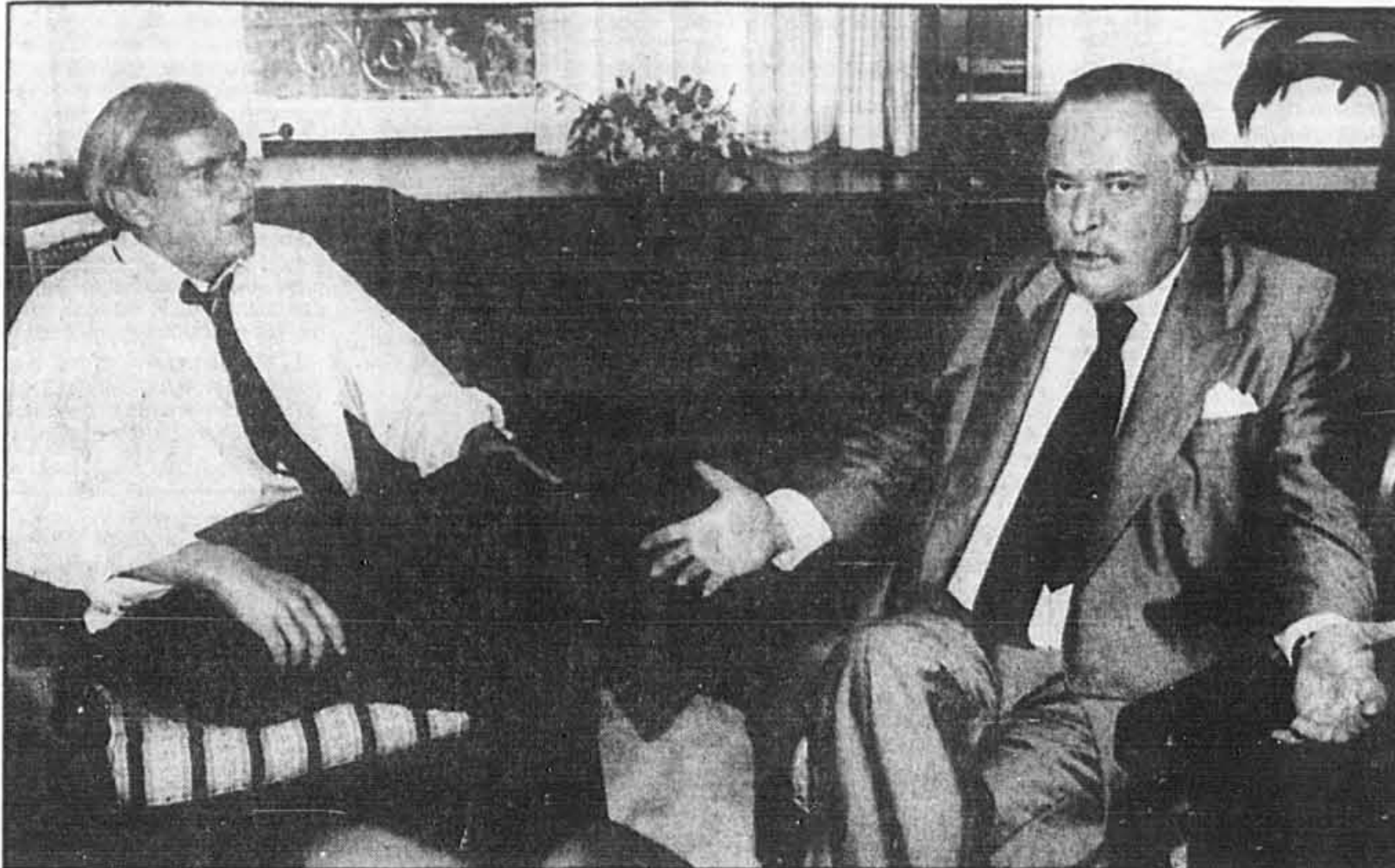
Le chef du Parti québécois, Jacques Parizeau, a rencontré hier le premier ministre de l'Ontario, David Peterson. « Nous ne partageons pas la même vision du pays », a constaté ce dernier

M. Parizeau déplore que, pour la première fois dans cet accord,