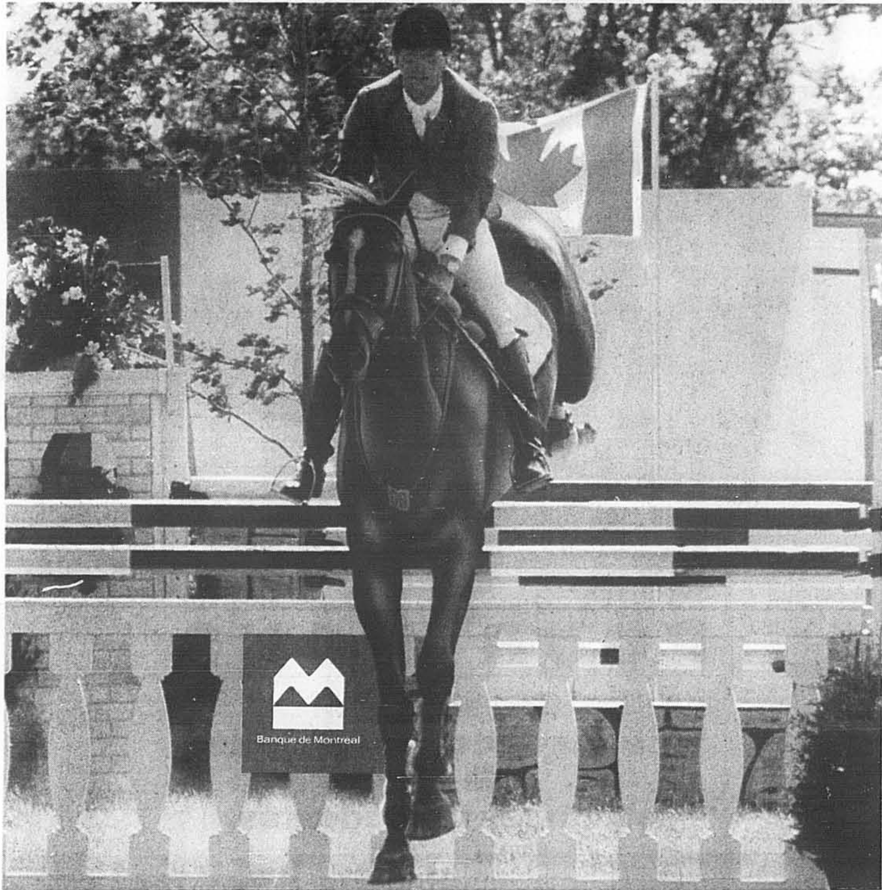
Ian Millar et Big Ben - deux fois champions de la Coupe du monde

“ENSEMBLE...VERS LE SUCCÈS!” — Ian Millar