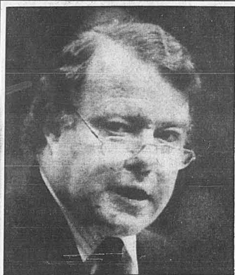
Le président du Conseil du Trésor, Robert de Cotret, a cité des statistiques pour montrer que le gouvernement conservateur exerçait un meilleur contrôle quant à l'utilisation des avions gouvernementaux que le précédent gouvernement.

« L'Assemblée nationale vote des crédits pour des programmes précis. Si l'argent n'est pas dépensé, il n'est pas recyclable pour d'autres usages. Mais on ne réduit pas le budget du ministère de l'Environnement », explique Daniel Johnson.