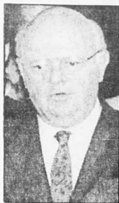
Joao Baena Soares, secrétaire général de l'OEA

Le jovial ambassadeur s'anime, s'empourpre même lorsqu'il entend