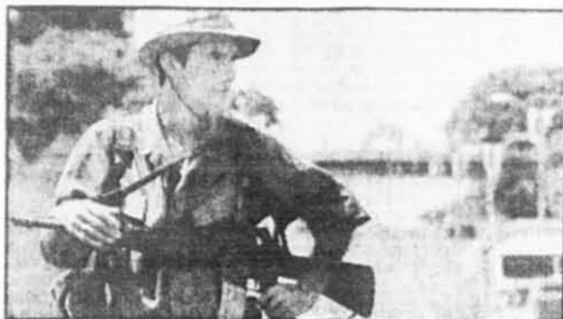
Quelque 4 000 policiers et gardes nationaux, mitrailleurs aux poings, patrouillent déjà la capitale du Costa Rica en prévision du Sommet des pays de l'hémisphère.

De même, les boulevards et les rues parallèles qu'emprunteront