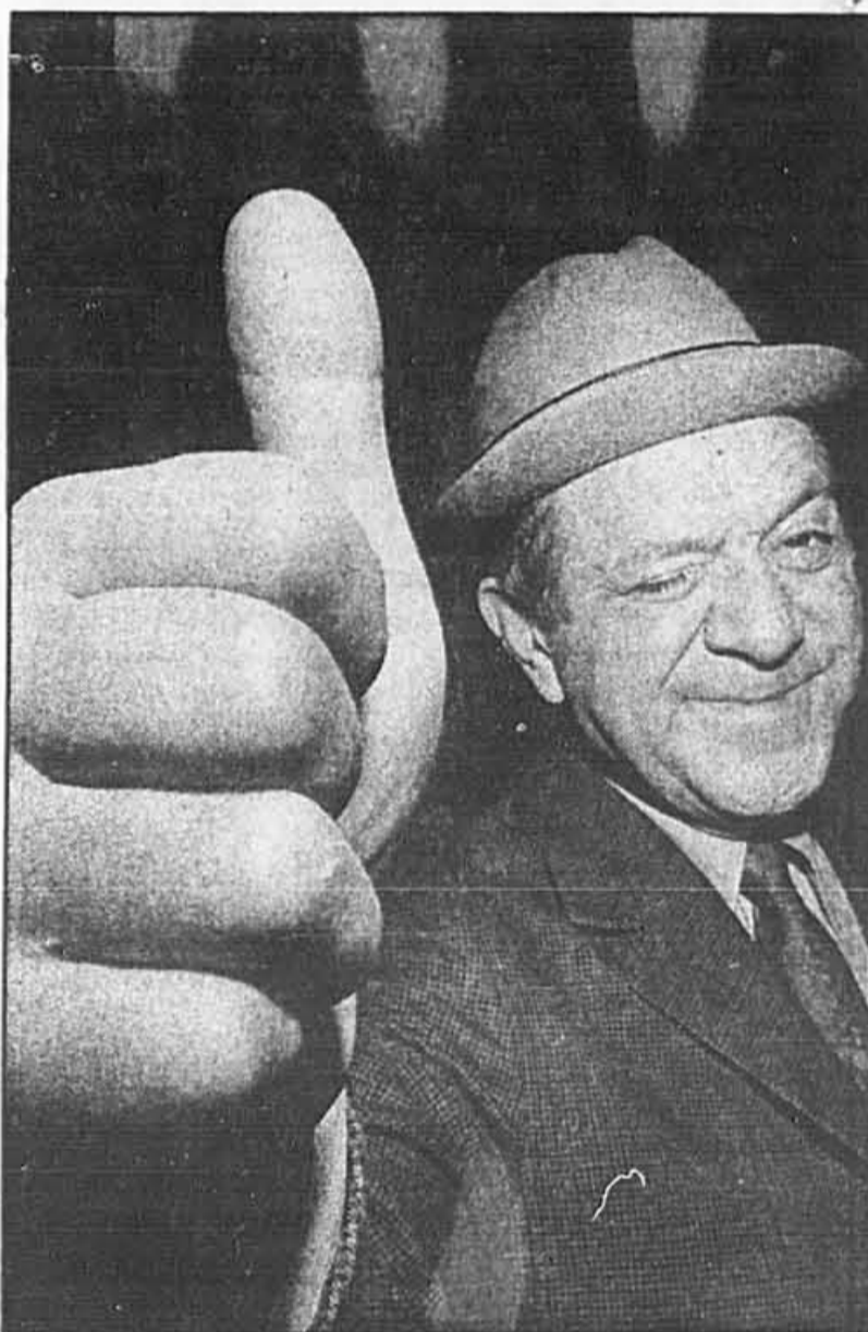
Il y a 20 ans, le travailleur québécois s'identifiait à Olivier Guimond. Mais la société a évolué. La publicité aussi.

nements de pubs venues du monde entier. Entre autres choses, on remarque l'humour des Britanniques, la subtilité des Japonais, la démesure et l'émotion des Américains. Bref, on peut mieux saisir les valeurs et l'esthétique des pays dont ces pubs sont issues. Il faut donc souhaiter une publicité québécoise plus forte et plus belle. Car cette dernière est frappée des mêmes maux qui affligent tant d'autres secteurs de notre société: des ressources limitées (il suffit de comparer les budgets de production des pubs françaises et québécoises) et l'obligation encore trop fréquente d'adapter (non de créer) ce qui vient de Toronto. La publicité nous renvoie à ce que nous sommes comme société. Elle ne représente pas plus un quatrième pouvoir qu'un murmure marchand. La publicité, c'est tout simplement un moyen supplémentaire pour une société moderne de s'exprimer et de s'affirmer.