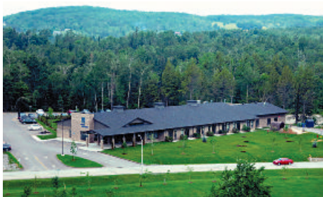
Maison Aube Lumière Aimer la vie