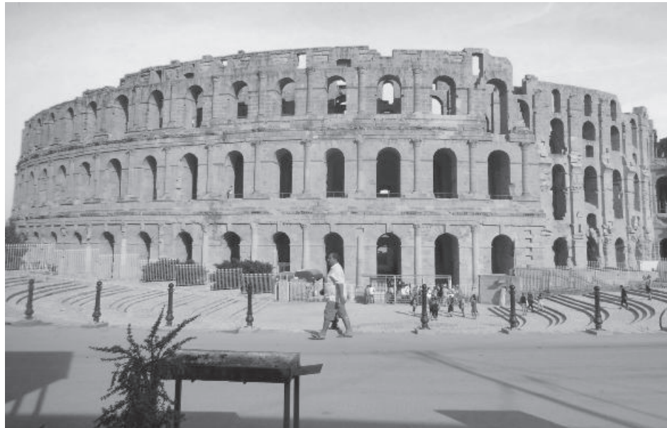
L'amphithéâtre El-Jem, aussi appelé Colisée de Thysdrus, est un amphithéâtre romain situé dans l'actuelle ville tunisienne d'El Jem, l'antique Thysdrus de la province romaine d'Afrique.

Depuis le mois de juin dernier, Tunisair offre des vols directs vers Tunis où l'on peut se rendre pour des circuits de visite, des forfaits tout-inclus ou encore pour des forfaits longs-séjours. Comme il s'agit d'un petit pays, il est assez aisé de faire le tour des principales attractions en 2 semaines. Autour de Tunis, on retrouve Carthage, une cité qui a tenu tête à Rome, certains vestiges subsistent de cette époque. Sidi Bou Saïd, une ville