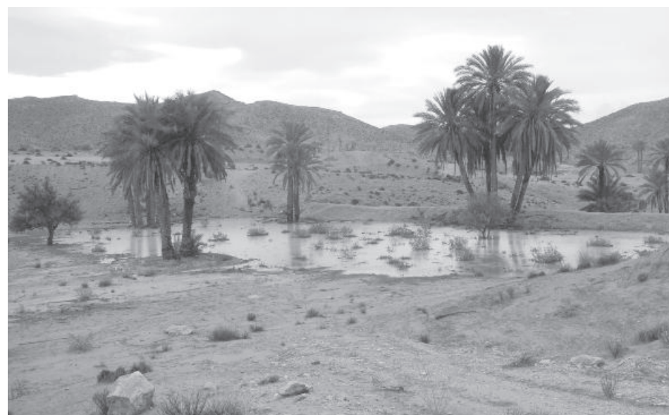
Une oasis au sud de la Tunisie.

Pour ceux qui souhaitent voyager, la Tunisie est une destination intéressante qui sort de l'ordinaire.