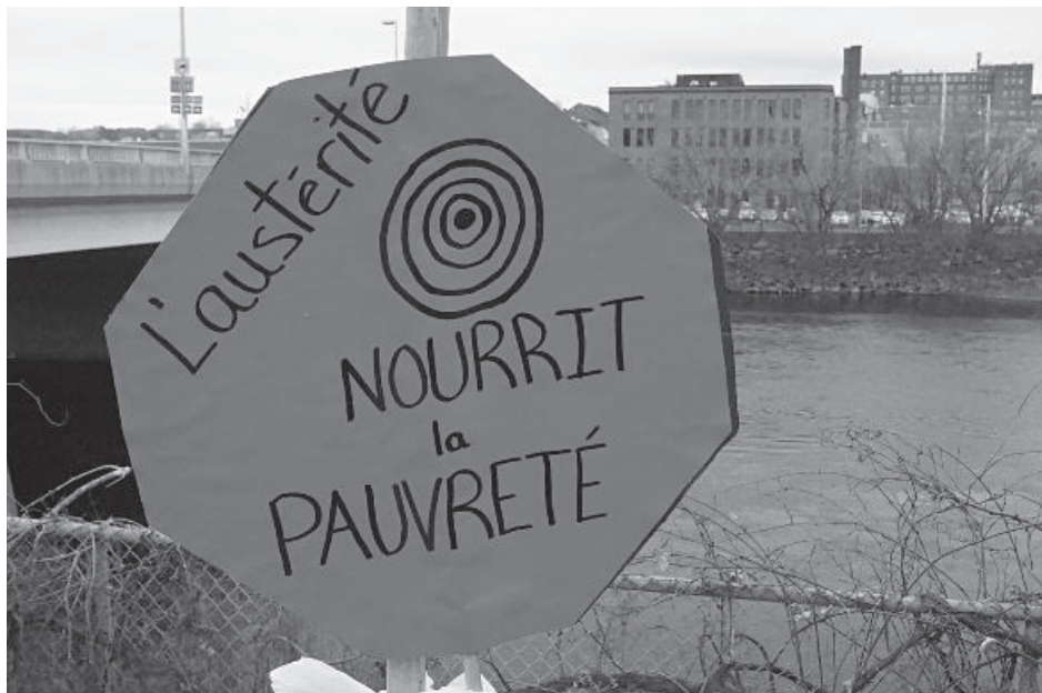
Les coupures dans les services publics appauvrissent la population, celle-ci se tourne vers les organismes qui sont déjà à bout de souffle et qui n'ont pas les moyens de soutenir tout le monde.

Les inquiétudes sont aussi vives dans le milieu communautaire. Sans rehaussement de financement de leur mission de