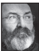
Marcel Morin Chroniqueur et photographe