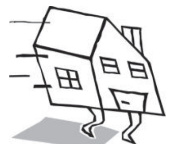
Table itinérance de Sherbrooke

Aide à la recherche de logement et accompagnement en logement (819) 791-0400