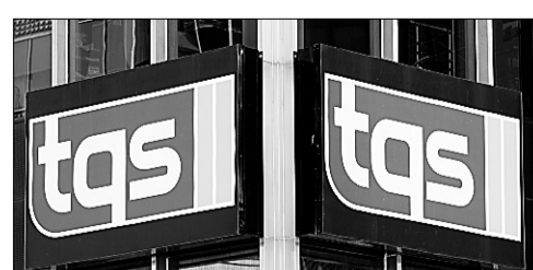
Nos reportages de proximité sur la scène locale s'illustrent à un point tel que le concept a été imité, plaide Martin Robert.

Cette attaque en règle teintée de mépris et de snobisme souligne son culot et sa rancune. En effet, il faut regarder notre société de très haut pour insulter de la sorte les quelque 600 000 téléspectateurs québécois qui consultent fidèlement, malgré les tempêtes, l'une ou l'autre de nos émissions d'information chaque jour. Pour se réjouir de la perte probable