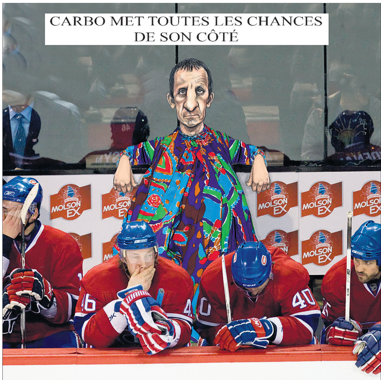
CARBO MET TOUTES LES CHANCES DE SON CÔTÉ

Tout cela pour dire qu'entre la futile chasse au scandale de l'opposition et la novlangue des bureaucrates, cette commission parlementaire fut une totale perte de temps.