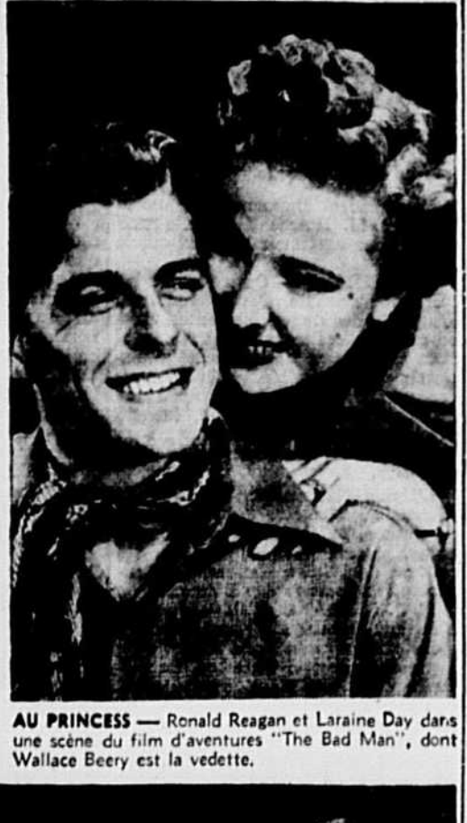
AU PRINCESS — Ronald Reagan et Laraine Day dans une scène du film d'aventures "The Bad Man", dont Wallace Beery est la vedette.