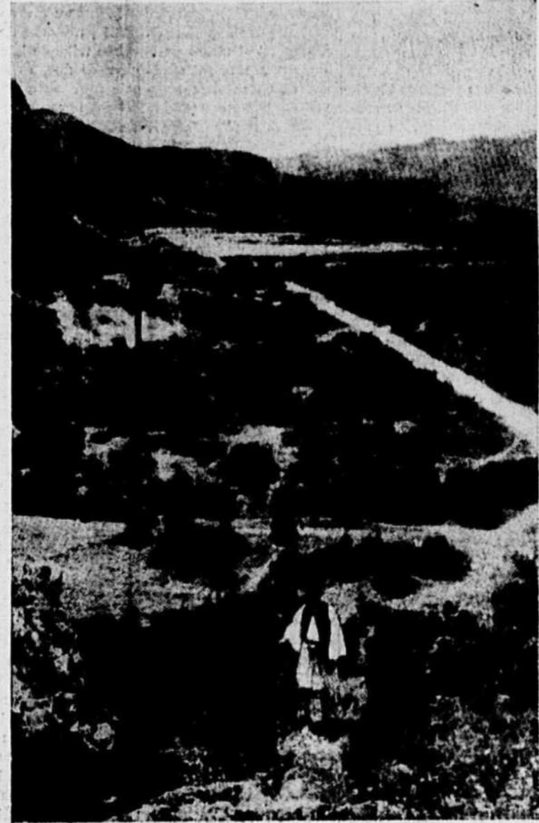
C'est dans la région désolée qu'illustra cette photo du défilé fameux des Thermopyles qu'aux dernières nouvelles précises, reçues de Grèce, les troupes britanniques et grecques poursuivent toujours courageusement, afin d'arrêter la poussée allemande en direction d'Athènes. Hier soir, il était impossible de savoir exactement où en étaient les opérations militaires dans ce dernier secteur du front des Balkans.