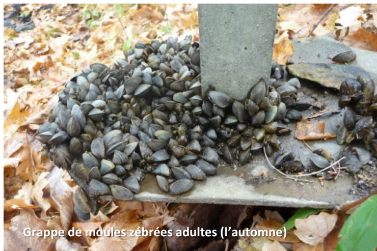
Grappe de moules zébrées adultes (l'automne)

Notre souhait ? Que Saint-Hubert devienne reconnue comme une des municipalités québécoises qui ont agi AVANT d'être aux prises avec les ravages des espèces envahissantes. Que Saint-Hubert devienne le modèle à suivre, plutôt qu'un autre de ces endroits dépassés par la situation.