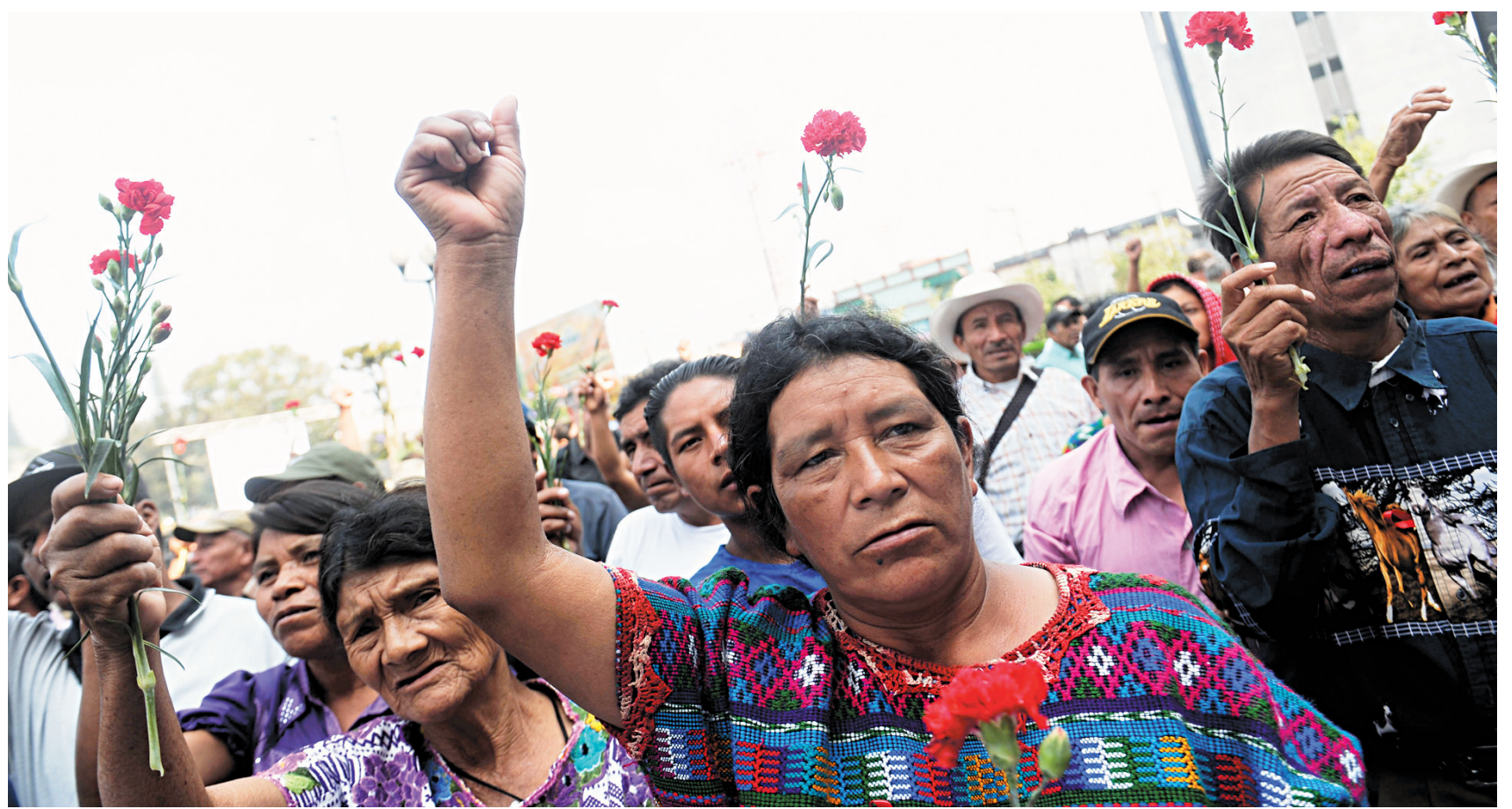
Des Mayas Ixils ont manifesté récemment devant la Cour suprême du Guatemala.