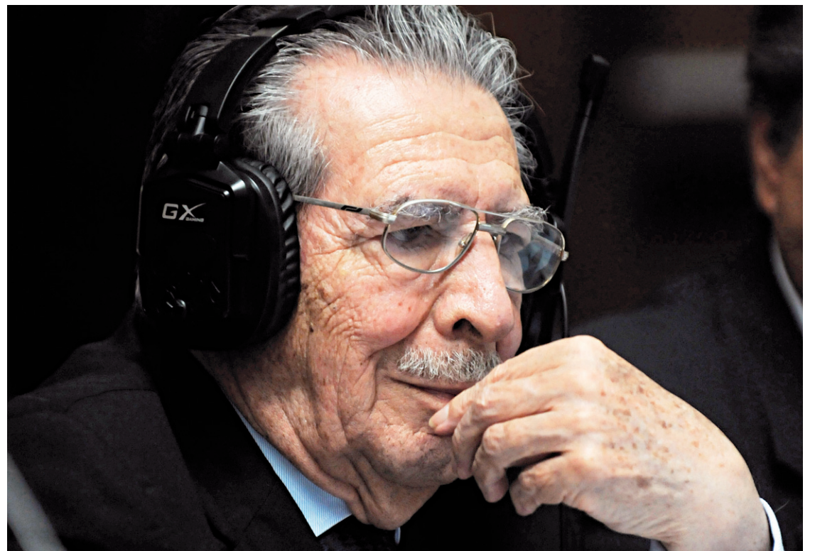
Ríos Montt pendant son procès