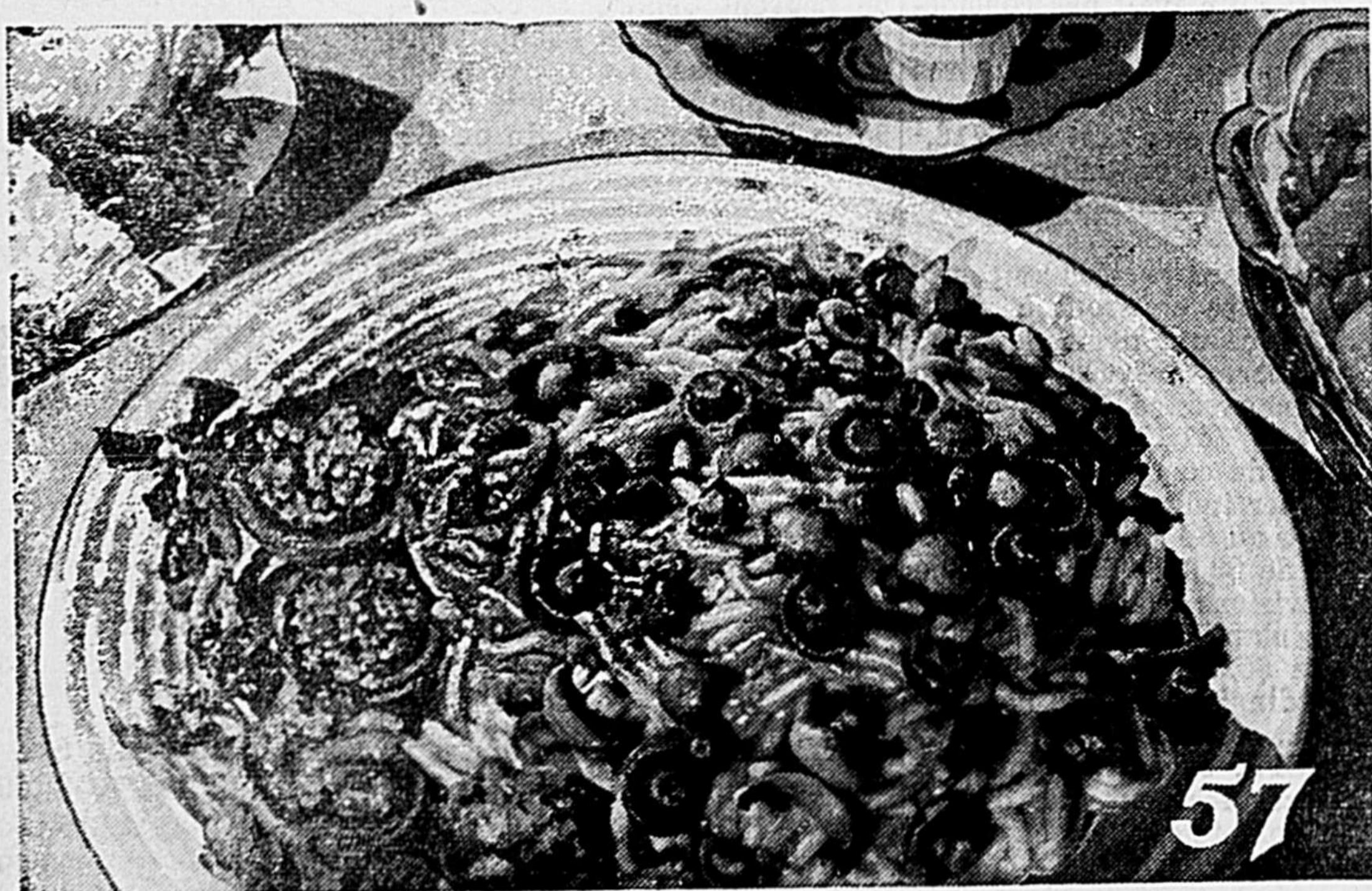
SPAGHETTI CUIT HEINZ avec CHAMPIGNONS

● Désormais tous les menus peuvent être intéressants. Achetez quelques boîtes de Spaghetti Cuit Heinz ou de Macaroni Cuit Heinz—et faites que chaque repas soit un banquet! Essayez aujourd'hui la recette qui est donnée ici—ou bien faites simplement chauffer et servez tel que provenant de la boîte.