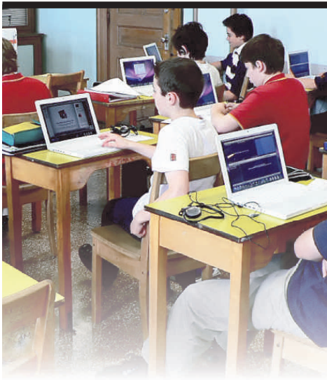
Le laboratoire mobile de 38 MacBook.

Le Petit Séminaire de Québec offre des programmes d'études qui permettent une triple certification à la hauteur des attentes de chacun. Le programme d'éducation internationale se concentre sur le développement intégral de l'élève. Qu'il s'agisse du volet SEBIQ comportant une série d'enrichissements ou du volet original du baccalauréat