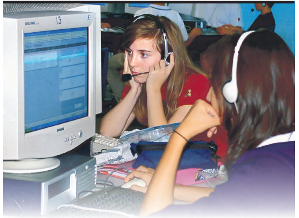
Le logiciel d'apprentissage «Tell me More».

En français (langue maternelle), 15 minutes de lecture obligatoire tous les jours. En anglais, 3 niveaux reconnus par le MELS dont l'anglais langue maternelle. En espagnol, une option jumelée à un voyage d'immersion. En mandarin, une activité parascolaire qui prépare à un voyage en Chine.