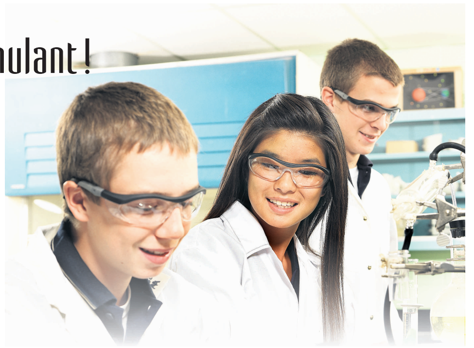
L'événement d'envergure Expo-sciences prend tout son sens à Saint-Jean-Eudes.

région, mais l'objectif était ailleurs. L'objectif, c'était de créer l'environnement sportif le plus motivant pour tous ceux et celles qui canalisent une partie de leurs énergies et de leurs talents vers le dépassement individuel et collectif. Les équipements sont dignes de champions. Par leur qualité, par leur modernité, ils créent les conditions mêmes du succès. Les élèves sont ainsi stimulés au max: l'école est leur école.