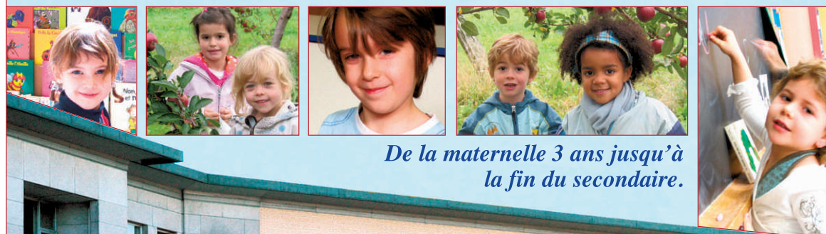
De la maternelle 3 ans jusqu'à la fin du secondaire.

Examen d'entrée en 1 re secondaire le samedi 16 octobre 2010