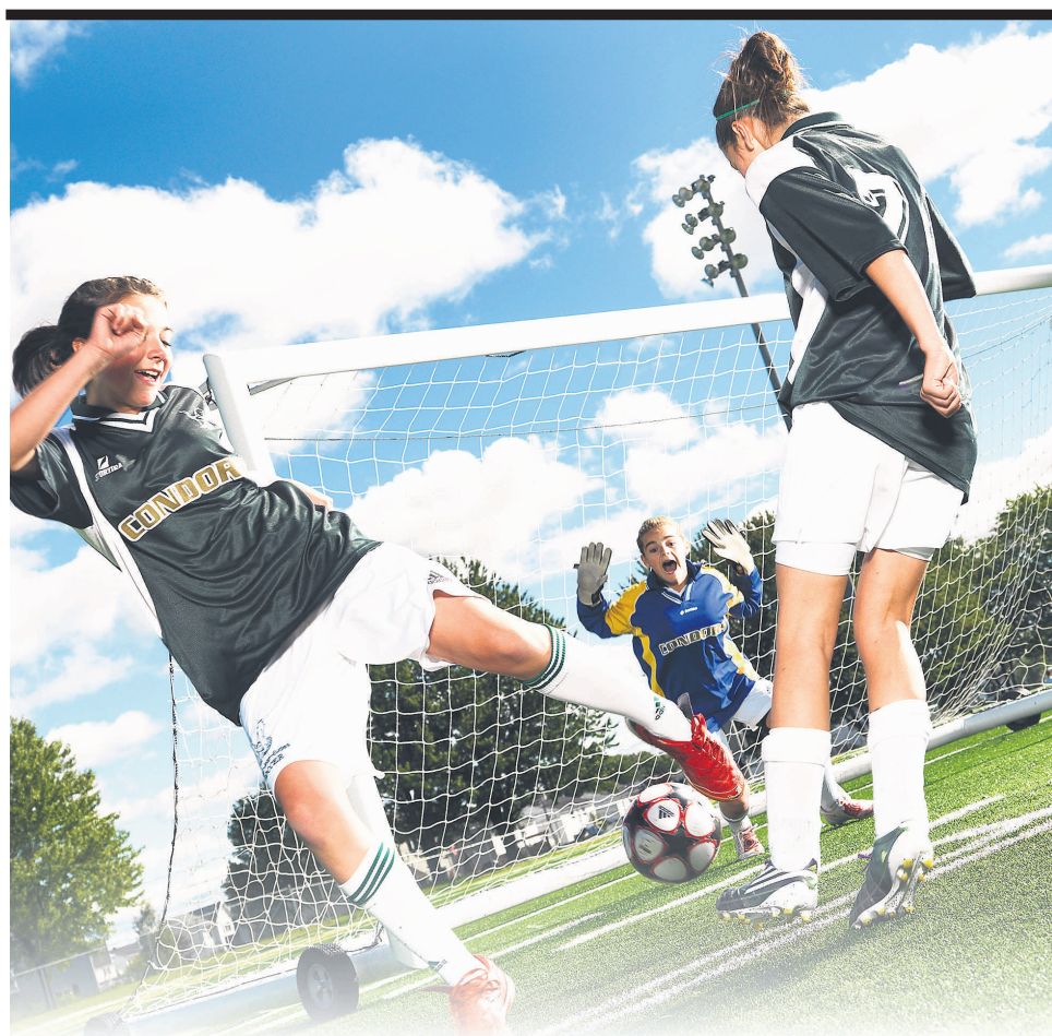
Les activités sportives permettent aux élèves d'atteindre leurs buts.

Saint-Jean-Eudes est devenue l'école secondaire privée la mieux équipée de la