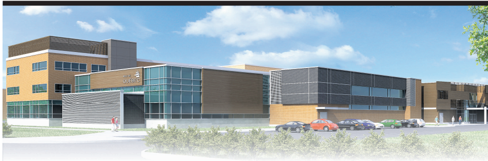
Le nouveau Saint-Jean-Eudes comprend un centre aquatique municipal.

L'école secondaire privée Saint-Jean-Eudes s'est offert une nouvelle identité visuelle. Caprice? Coquetterie? Oh! que non! La raison de cette métamorphose est la suivante: en quelques années, l'école est devenue une véritable boule d'énergie que les élèves s'approprient chaque jour pour vivre quelque chose de très intense et de terriblement motivant: le succès. Le succès scolaire, bien sûr, mais plus encore. Ici, à Saint-Jean-Eudes, l'énergie est imprégnée partout: dans les gymnases, dans les salles de théâtre, dans les locaux de la radio étudiante, dans les espaces de vie et jusque dans les salles de cours où les enseignants visent d'abord et avant tout la réussite. Le monde d'aujourd'hui est celui de l'énergie créative et Saint-Jean-Eudes lui donne toute la place. Survol d'une institution où plane l'énergie... du succès.