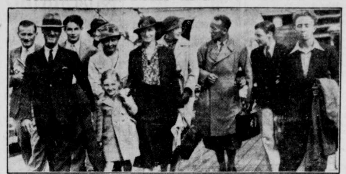
Ce groupe de citoyens anglais qui se sont enfuis d'Espagne pour échapper aux affres de la rébellion arrivent à Tilbury à bord de l'Otranto. La plupart ont abandonné tous leurs biens. Le navire "Sir Noel Birch" les recueillit sur la plage espagnole.