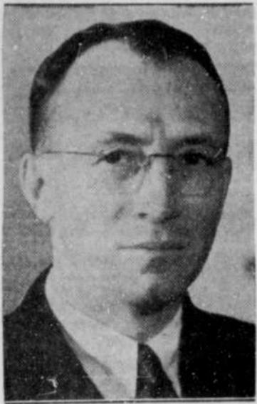
L'honorable Césaire GERVAIS, C. E., ministre des Travaux Publics et des Mines, dans le cabinet Godbout qui sollicite les suffrages de l'électorat de Sherbrooke comme candidat libéral.