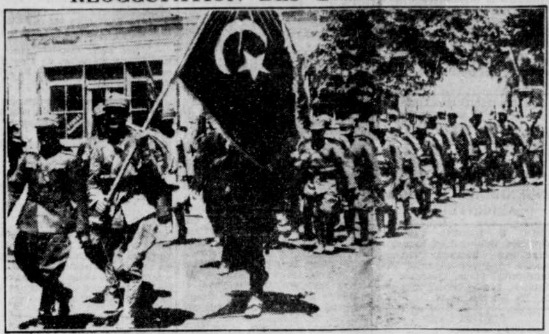
Voici la première photographie arrivée en Angleterre, qui fait voir la réoccupation des Dardanelles, par les Turcs.