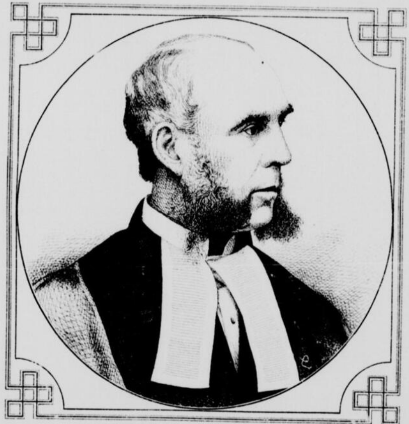
L'HON. SAMUEL HENRY STRONG