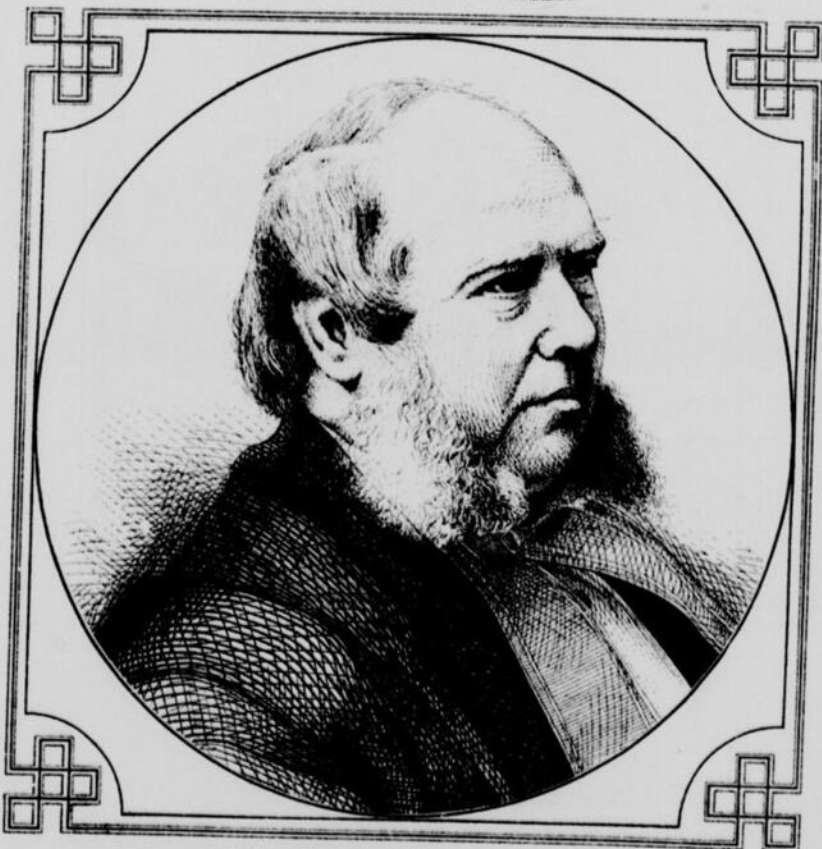
L'HON. WILLIAM JOHNSTON RITCHIE