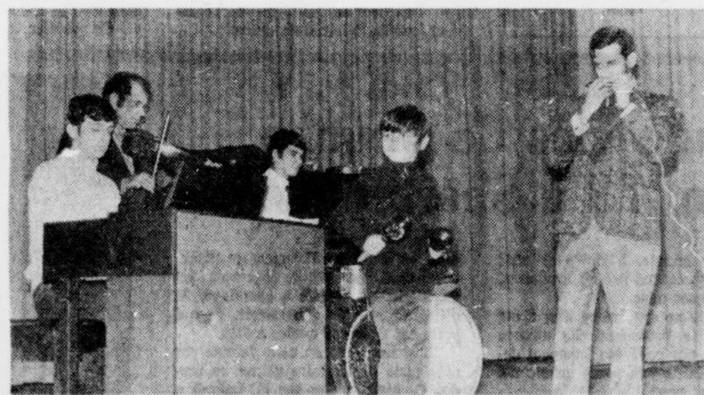
Tout y était pour faire un éclatant succès de la visite annuelle des Chevaliers de Colomb à l'Ermitage. La musique d'antan, interprétée par des gens "présents", a créé une atmosphère des plus joyeuse.