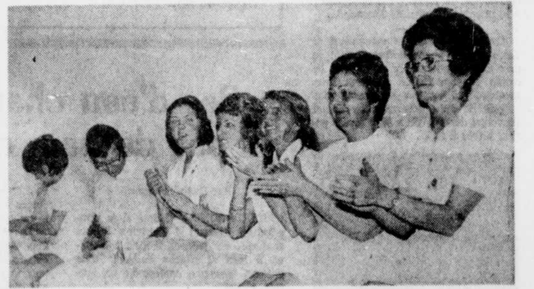
Même si les pensionnaires de l'Ermitage étaient l'objet de la fête, tout le monde s'est bien amusé. C'est ainsi que les infirmières et infirmiers de l'Ermitage ont participé aux réjouissances, et, tout de go...