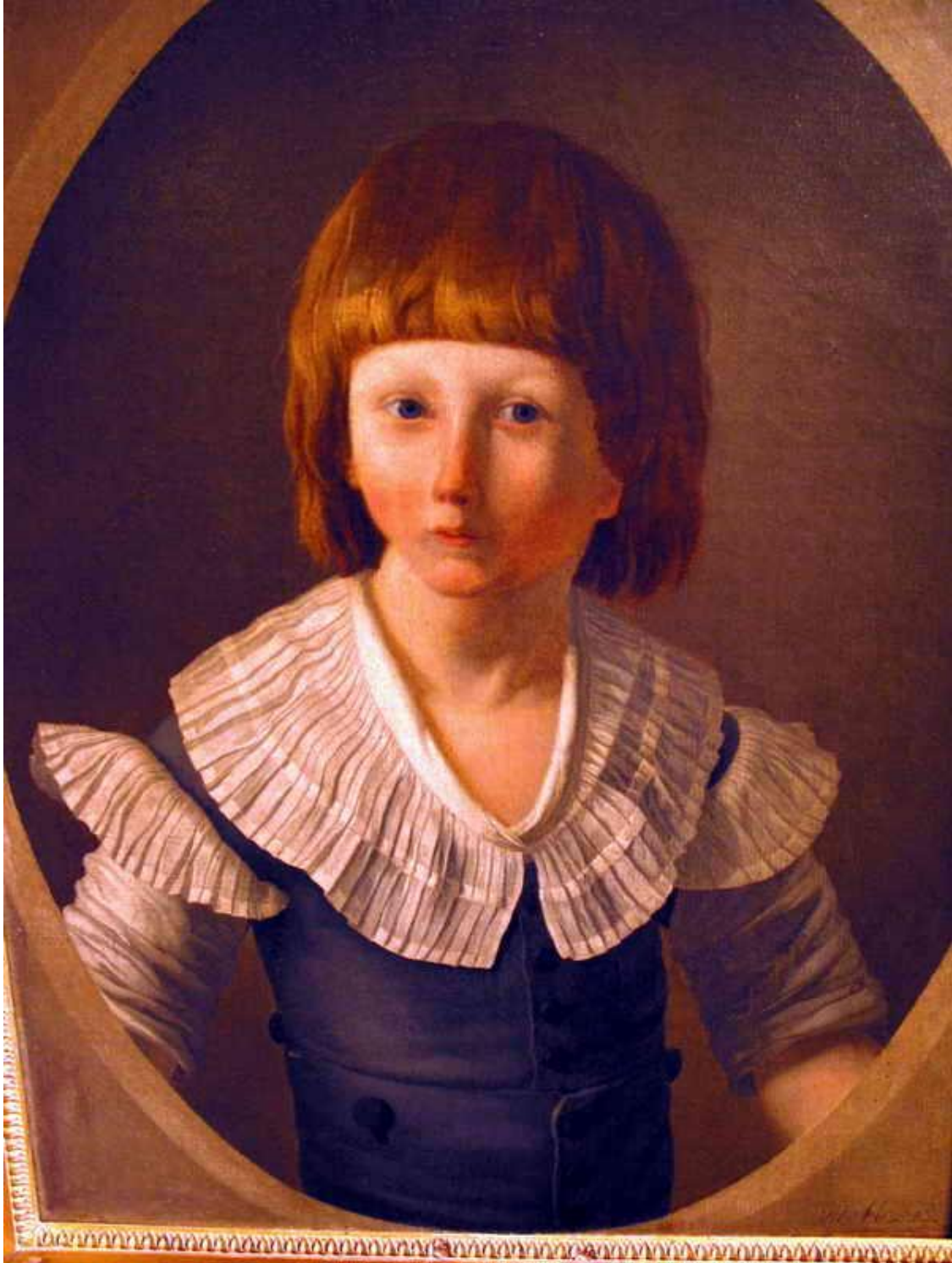
Le dauphin, futur Louis XVII (Tableau conservé au Musée Carnavalet, Paris)