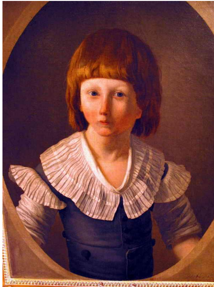
Le dauphin, futur Louis XVII (Tableau conservé au Musée Carnavalet, Paris)