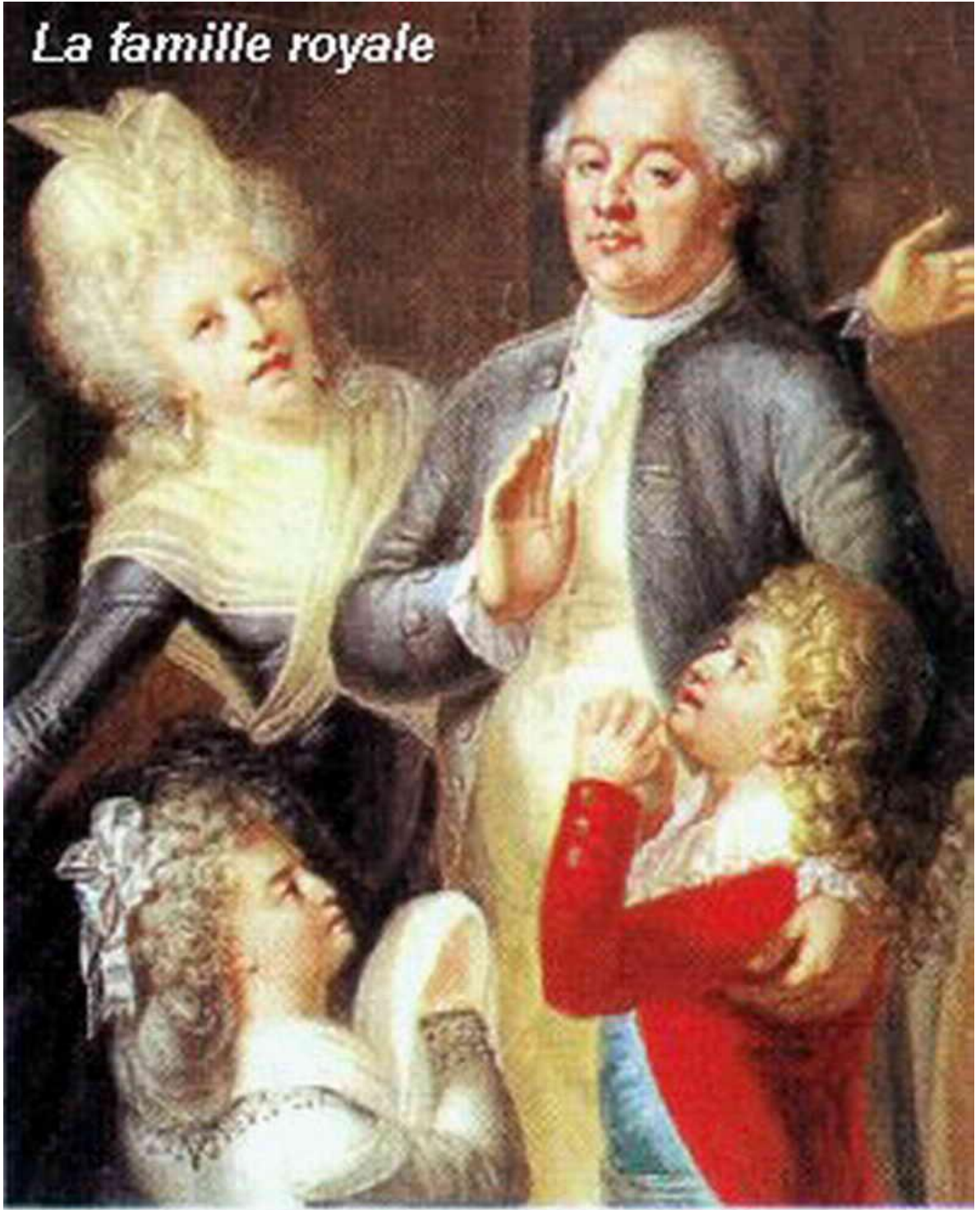
Louis XVI, Marie-Antoinette, le dauphin et sa sœur.