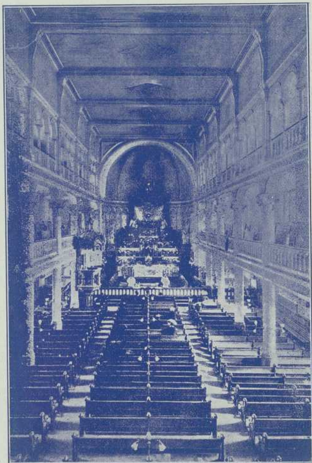
Eglise du C. S. Sacrement où se tiendront les Séances Sacerdotales.