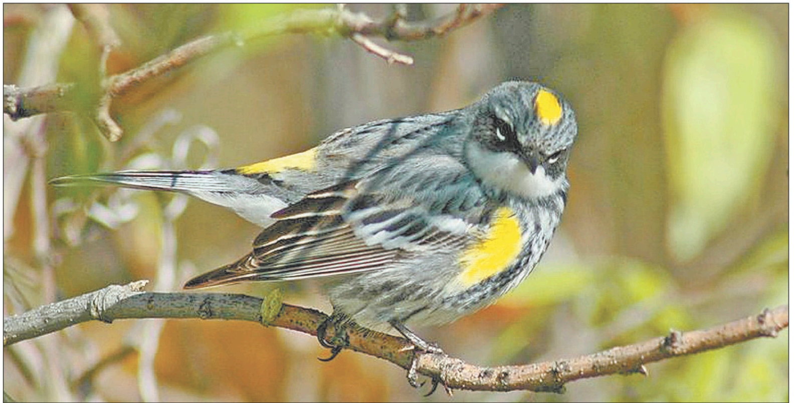
COLLABORATION SPÉCIALE, SERGE BEAUDETTE

Mais par-dessus tout, parce que Mme Brûlotte partage dans ce petit bouquin dont c'est la troisième réédition quelques excellents trucs pour comprendre, observer et identifier les oiseaux du Québec. La liste des