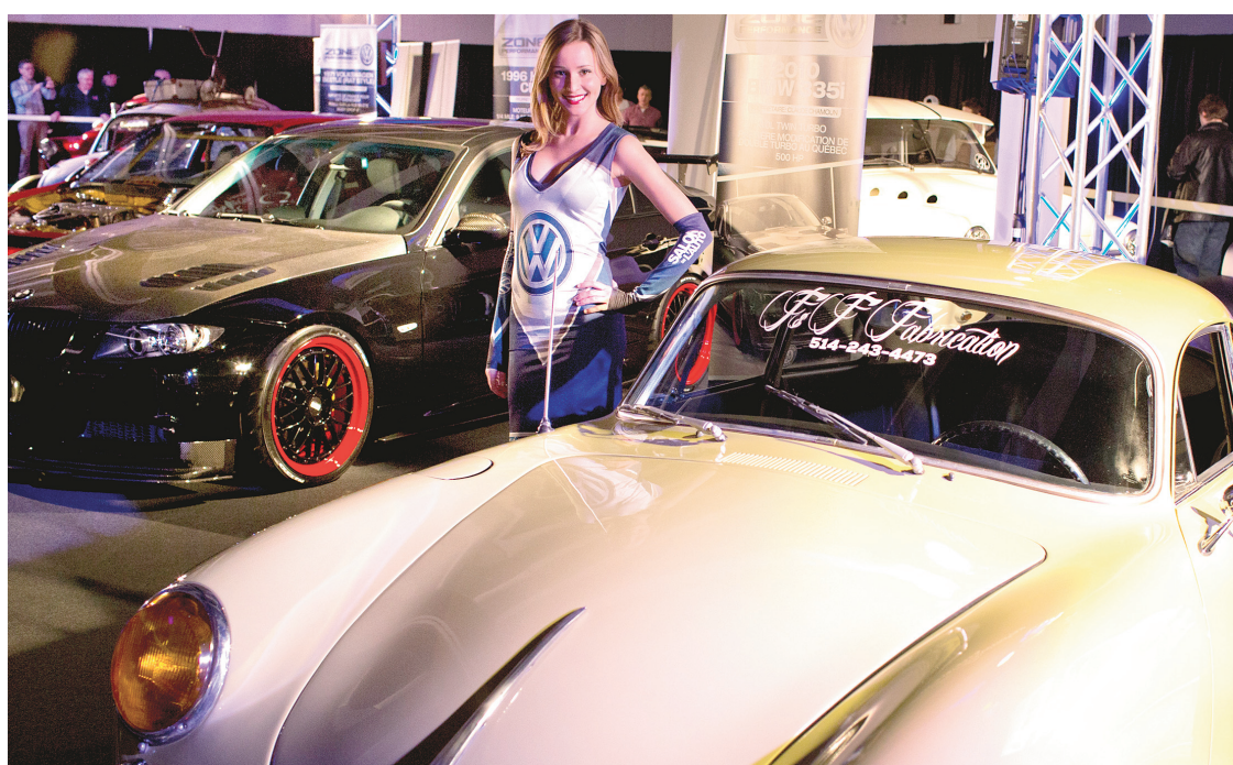
Beaucoup des voitures qui sont valorisées par la présence des hôtes ne sont pas à vendre.

Si rouler électrique apparaît comme une option marginale, la nature et le plein air occupent passablement l'imaginaire automobile