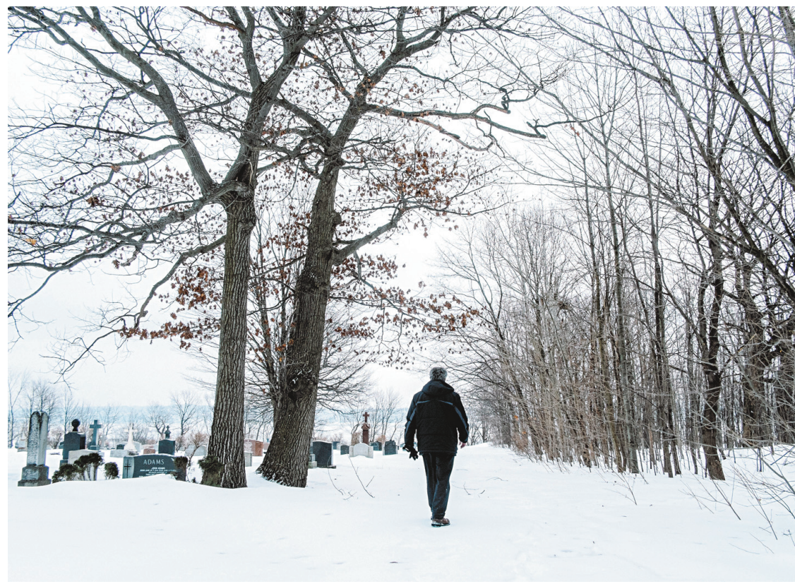
RENAUD PHILIPPE LE DEVOIR

Le projet Woodfield menace un boisé bordant le cimetière Saint-Patrick, face au fleuve.