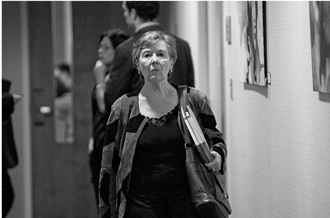
Francine Lalonde s'était retirée de la vie politique en 2010 après que son cancer fut revenu.

Députée de Mercier puis de la Pointe-de-l'Île à Montréal, Francine Lalonde a fait du suicide assisté l'un des grands combats de sa vie politique, déposant son premier projet de loi d'initiative parlementaire en la matière dès 2005. « C'est une responsabilité qu'on