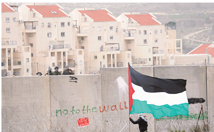
La colonisation est la source de vives tensions entre Israël et les Palestiniens. Des manifestations ont lieu régulièrement.